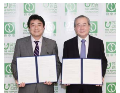
▲左から高野市長、尾形理事長