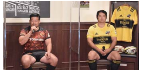
▲過去のトークショーの様子

東芝ブレイブルーパス東京・東京サントリーサンゴリアスの選手を迎え、ラグビーワールドカップ2023の楽しみ方を語っていただきます。 ☎スポーツタウン推進課(☎335-4477)