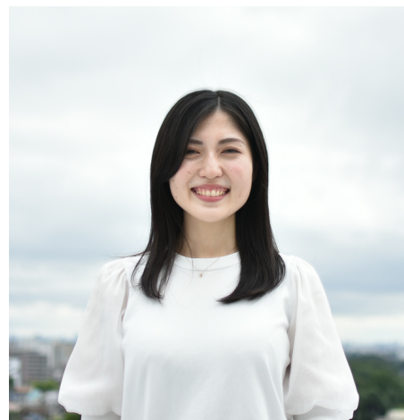
府中市職員採用2023 採用案内

児童手当や子どもの医療証等、子育て世帯への手当や医療費を助成する業務のほか、申請受付や医療証の発行等の窓口業務を行っています。最近では新型コロナウイルスの経済対策である、子育て世帯生活支援特別給付金の支給業務も担当しました。