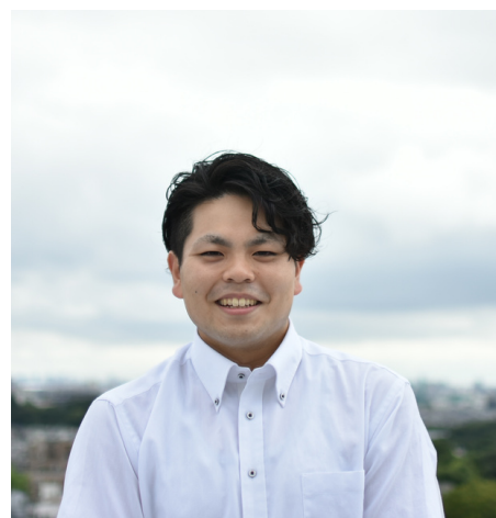
府中市職員採用2023 採用案内

障害のある方が安心して暮らせるようなまちづくりのための、システムやネットワーク構築を行っています。また、成年後見制度の手続き支援や虐待の調査など、障害者の方の権利擁護のための業務も行っていきます。