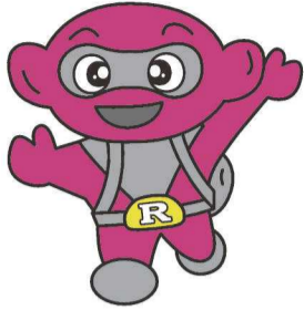
▲府中市のリサイクルマスコット リサちゃん