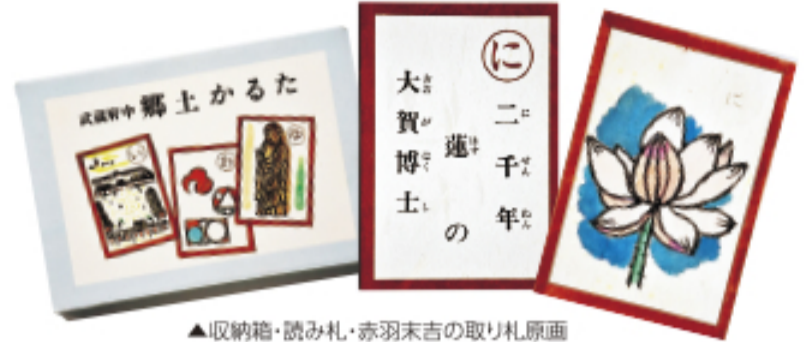
▲収納箱・読み札・赤羽末吉の取り札原画

今後は、この「かるた」の文化的・歴史的価値を将来にわたって長く維持するために、初刷一式と原画の保存を図るとともに、学校教育や多くの市民に広く親しまれ、利用していただけるよう、活用を推進していきます。