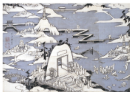
▲伊藤若冲 石峰寺図 京都国立博物館