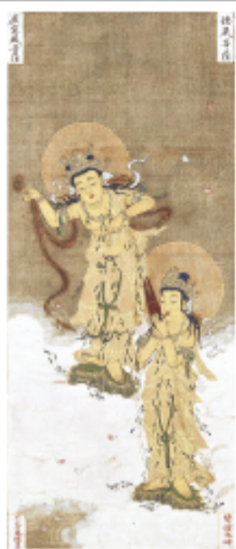
▲土佐行広 二十五菩薩来迎図 京都市・二尊院