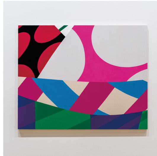
《untitled》2022年 植島コレクション蔵