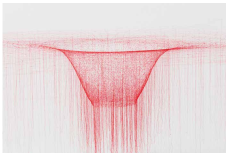
上 《May 13 2019》 2019年 木綿糸 下 《Knotted Thread-red-Φ18cm-Φ360cm》(部分) 2016-2017年 silk thread gallery 21yo-jでの展示 表面 《Knotted Thread-red-Φ18cm-Φ360cm》 2016-2017年 silk thread gallery 21yo-jでの展示