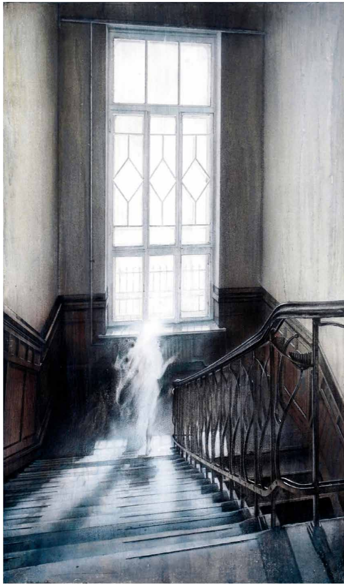
1 依代 2016-17 紙、パネルにミクストメディア 86.1×195.8cm 個人蔵 2 HARBIN 1945 AUTUMN 2015/2021 パネルに鉛筆、顔料、水彩 41×24.2cm 個人蔵 3 Chromatophore 2020-22 白亜地パネルに油彩 27.3×45.5cm 作家蔵 4 大野一雄舞踏研究所にて川口隆夫を描く諏訪敦 2020年11月16日 5 Mimesis 2022 キャンバス、パネルに油彩 259.0×162.0cm 作家蔵