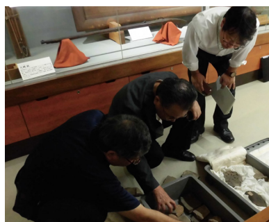
考古・美術工芸 調査風景 (大國魂神社宝物殿)

考古・美術工芸専門部会 市史編さん事業を進めるなか、本市ゆかりの美術品などの有形資料から歴史をひも解くことを目指して、本年新たな部会を立ち上げました。この部会では、考古学、美術史などの専門家に委員をお願いして調査や研究を実施するとともに、市民にわかりやすい刊行物の発行に取り組んでいく所存です。今後、市民の皆様のご協力をいただいで調査活動を進めてまいりたいと思いますので、どうぞよろしくお願いいたします。