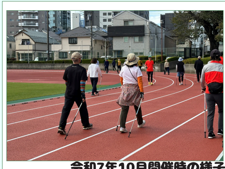
令和7年10月開催時の様子

年齢や性別を問わず、体力に自信のない方や運動の苦手な方でも自分のペースで楽しめる「ノルディックウォーキング」を体験してみませんか。