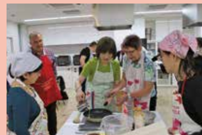
オーストリア料理講習会