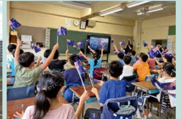
Australian Olympic Connectともだち2020プロジェクト