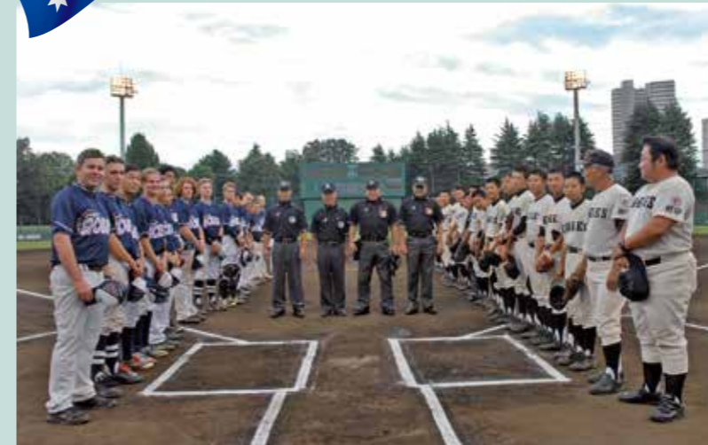
野球を通じた青少年の交流