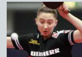
Sofia POLCANOVA (ソフィア・ポルカノヴァ) 2018年ヨーロッパ選手権 シングルス銅・ ダブルス銀・混合ダブルス銀