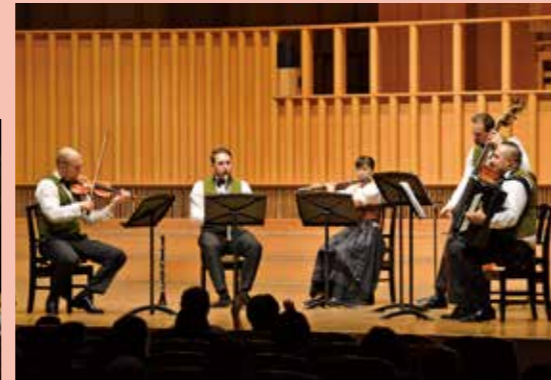
シュランメル音楽のコンサート