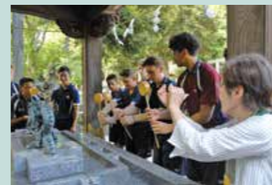
ロビーナ高校の府中訪問