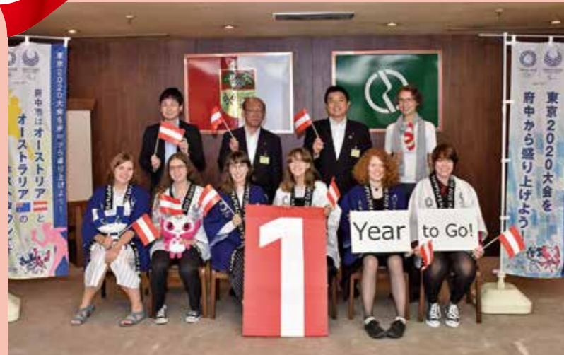
ヘルナルス区訪問団の表敬訪問