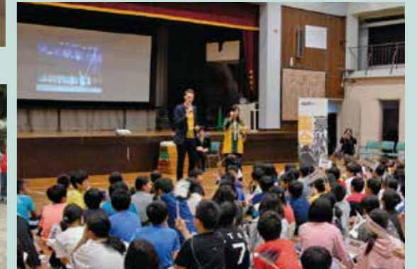
在日オーストラリア大使館による授業