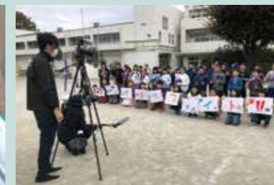
ホストタウン応援動画の制作