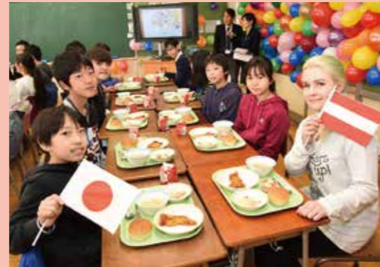
オーストリア料理の給食