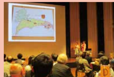
ヘルナルス区訪問団との市民交流会