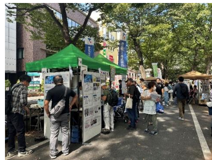
昨年の会場内の様子