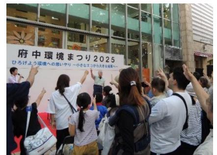
昨年のじゃんけん大会の様子