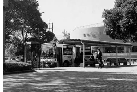
▲健康センターのバス停