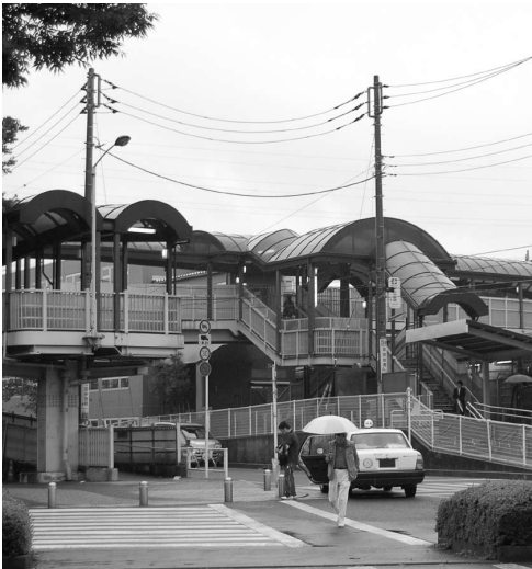
▲分倍河原駅の人道橋

か。都市整備部長 今後予測されるのは、当駅利用者数のマイナスイヤクとして、JR南武線新駅の設置により、通勤などの乗降客数の減、プラス要因としては、駅南口に商業施設の開設が予定されていることによる増が考えられる。議員 人道橋は老朽化が見られるが、安全性確保やバリアフリーへの対策等から、建替えなどが必要と思うがどうか。都市整備部長 建替えなどに