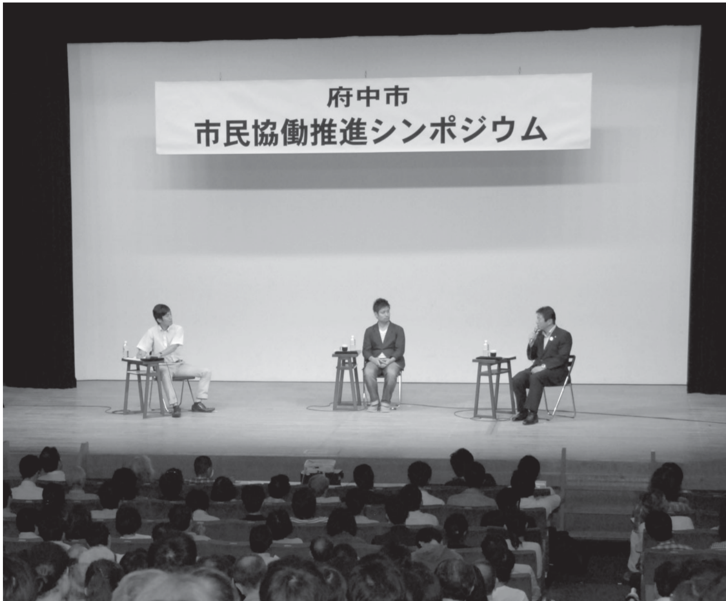
▲6月25日に行われた市民協働推進シンポジウムに多くの市民の皆さんが参加されました