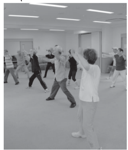
▲「元気一番!! ふちゅう体操」でロコモ予防

介護サービスの抑制にもつながるため、本市でも取り組むべきと考えるがどうか。市長 市民がロコモ予防の必要性を理解し、食事や運動など生活習慣の改善に取り組むよう、関係機関が連携をとりながら啓発を進めていくことが重要と考えている。議員 ロコモ予防を取り入れた市の事業について聞きたい。福祉保健部長 「元気一番!! ふちゅう体操」の普及を行っている。また、リフレッシュセミナーの開催や20歳から70