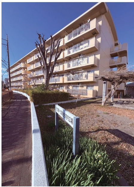
▲市営住宅の拡充を求める

議員 市施設について は、再編を中心とした 保有量の抑制が方向性 として示されているが、 主な内容について聞 きたい。 財産担当参事 部屋の 多目的化等による既存 面積以内の改築、類似 施設などの複合化によ る機能集約、民間施設 等による代替の検討に より総量の抑制を図る こととしている。 議員 市営住宅につ いては、設置目的を考 え