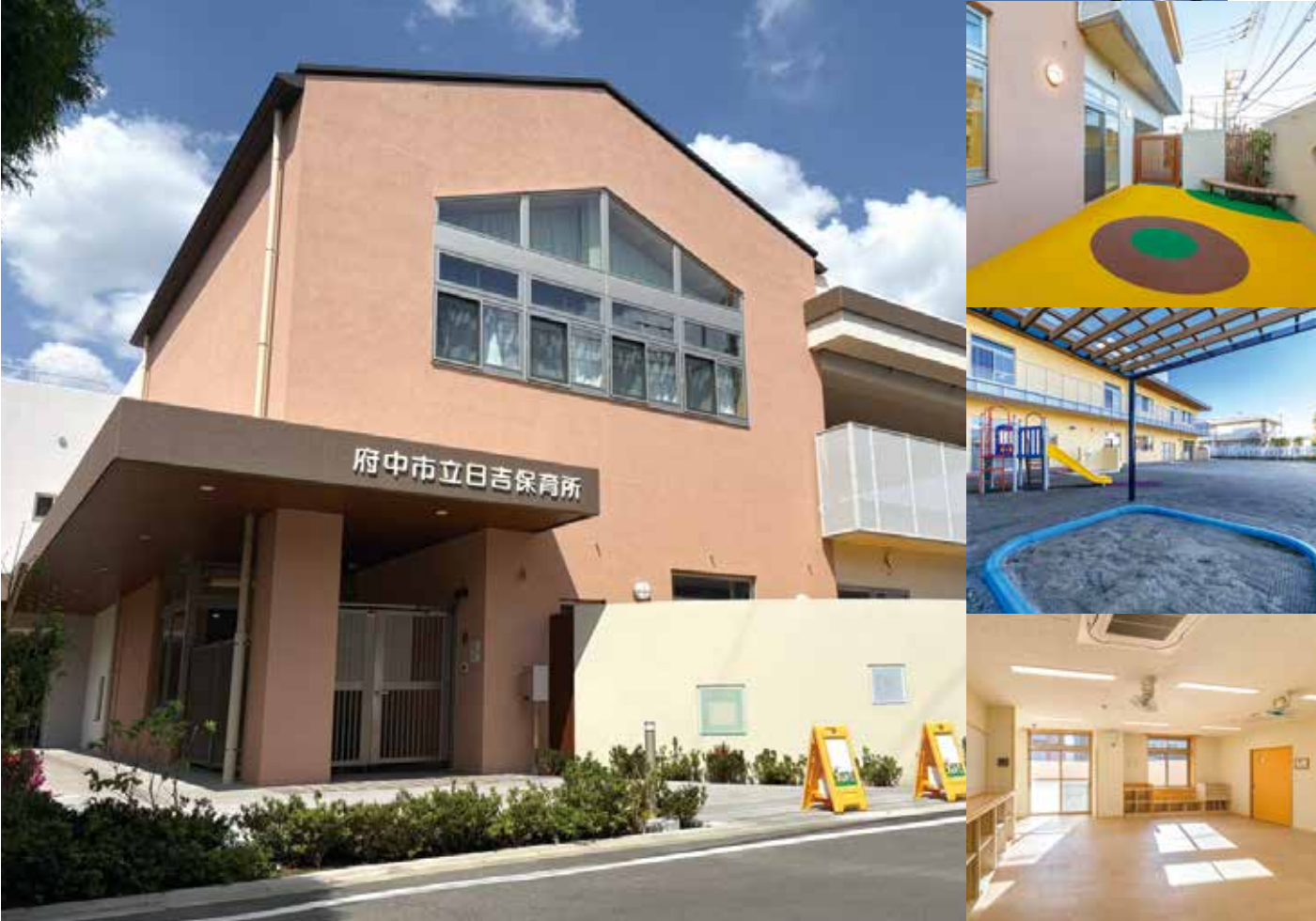
▶令和8年4月に開設した市立日吉保育所と地域子育て支援センター「はぐ」ひよし

令和8年第1回市議会定例会は、2月16日から3月16日までの29日間の会期で開催されました。 市長提出議案は、令和8年度府中市一般会計予算など37件を審議した結果、可決32件、同意2件、承認3件となりました。 委員会提出議案は2件を審議した結果、可決2件となりました。 議員提出議案は3件を審議した結果、可決3件となりました。 また、陳情2件が審議されました。