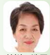
議員 近年、ワンルーム形式住戸が不動産投資向けに販売されている

まちづくりを進めるため、モデル事業に位置付けた。議員 複合化の必要性について、市の考えは。財産担当参事 部屋の統合による面積の削減効果は少ないが、廊下など共用部の削減効果が高いため、必要な手法と捉えている。また、建物を集約してコンパクトな施設とすることで、整備費用等の抑制も期待できる。令和7年国勢調査について「ポートレース平和島の新スタンドについて