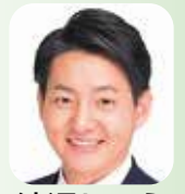
議員 第3次府中市公共施設マネジメント推進プランのモデル事業

いに対する不安は精神的負担にもつながると考える。そこで、コインランドリー、クリーニング業界等の専門団体と協定を結ぶ必要があると思うが、市の見解は。危機管理監 関係機関や民間事業者との連携を含め、避難所における洗濯環境の確保と感染症リスクの軽減のためにも、協定締結に向けて検討していきたいと考えている。