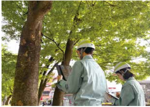
▲けやき並木の保護に努めます

委員 馬場大門のケヤキ並木は、令和6年度で国の天然記念物に指定されてから100周年を迎え、同年12月には「市けやき並木を守り育てる条例」も施行されている。けやき並木は、市民の憩いの場であり、イベント等が行われるにぎわいの空間であり、緑の中核的な拠点でもある。そこで、8年度の並木の保護の取組を聞きたい。