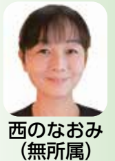
西のなおり (無所属)

中高生世代の 居場所づくり 市の考えは 現在の取組に加え 今後より良い居場 所づくりを検討する