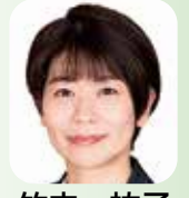
議員 押立町1丁目のマンション建設について

マンシヨンの民泊利用等に対して市として可能な対応は、協議の場で事業者に対して必要な対策等の指導が可能と考える