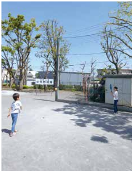
▼四谷第4公園でボール遊びをする子どもたち

検を進めている。 議員 下水道管に異常が認められた場合の対応指針等はあるか。 都市整備部長 公益社団法人日本下水道協会が策定した下水道維持管理指針等に基づき、破損状況と緊急度をそれぞれ3段階に区分し、特に破損状況が著しいと判断した箇所について早急に修繕工事に着手している。 府中市の空き家対策について