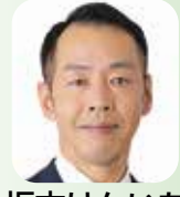
議員 災害時における洗濯支援の考え方について

管理規約や賃貸借契約書に条文を設けるとしているが、これが遵守される根拠はあるか。都市整備部長 条文を設けることで、違反行為を確認した際、管理組合において、損害賠償請求などの必要な対応を講じることが可能になると聞いています。府中市計画道路3・4・3号について「H P V ワクチン薬害訴訟」について