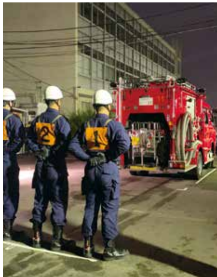
▲現業事務所の敷地内で訓練に励む消防団

事業の倉庫や資材置場としての利用、また全国消防操法大会に向けた消防団の訓練場所の確保といった工事期間中の利用に関する相談がある。このため、工事期間中は仮囲いや工事車両の導線などにより利用できる範囲に制限が生じるが、敷地内の利用状況を考慮しつつ、極力工事に影響が生じないよう関係課と調整を図りながら進めていきたい。