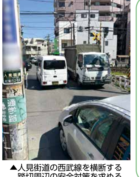
▲人見街道の西武線を横断する踏切周辺の安全対策を求める

都市整備部長 交通量調査等に加え、関係法令の規定台数を総合的に勘案し1600台程度を見込んで聞いている。