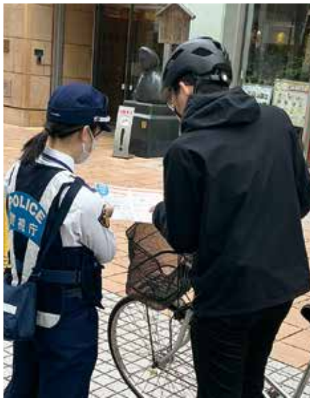
▲運転中のながらスマホなどは取締りの対象です

議員 市内の不登校児童・生徒が増加傾向だが、これに対する市の取組と成果は。 教育長 学校、保護者、教育委員会が連携し個々の状況に応じた支援を充実させたことで、増加率は前年度より低下している。更に、サポートルーム利用者の半数以上が回復傾向、現状維持を示すなど成果も出ている。 議員 令和8年度の不登校に関する施策を聞きたい。 きたい。中学校入学後の人間関係づくりを目的に実施している、ふれあい自然教室の全額公費負担やスクールソーシャルワーカーの増員を新たに予定しており、不登校の未然防止等を図っていく。 本市の地域医療における物価高騰の影響について ●東府中2号踏切等の安全対策について 東府中駅周辺のまちづくり (その3)