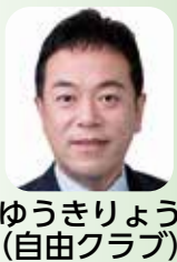
ゆうきりょう (自由クラブ)

自閉症・情緒障害特別支援学級設置に向け視察を行う考えは支援の在り方を考える上で参考となるため今後検討していく