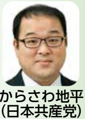
からさわ地平 (日本共産党)

に係る設備導入経費は約1億4500万円だが、削減額を踏まえると、約15年間で当該経費の回収が見込めると