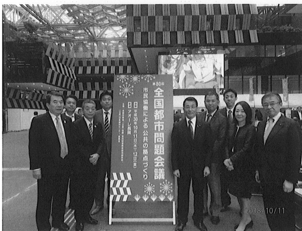
アオーレ長岡入口にて集合写真

この2日間の都市問題会議に参加し、得ることが出来た成果については、府中市行政へ活用していくことが我々府中市議会市政会の使命であると捉え、引き続き活発な議会運営に取り組んで行く事が求められる。