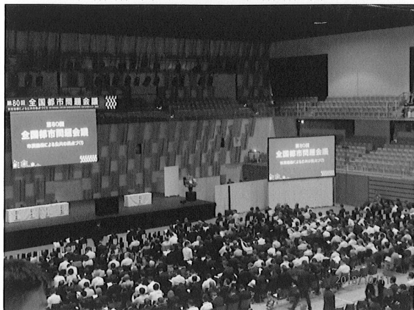
全国都市問題会議の全容