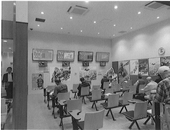
・施設内座席の様子