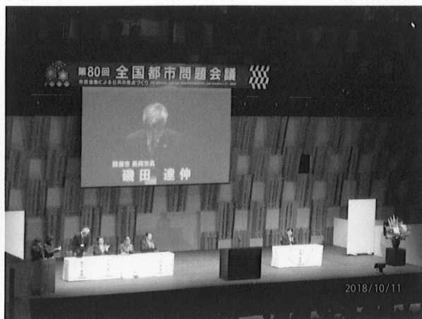
全国都市問題会議の様子