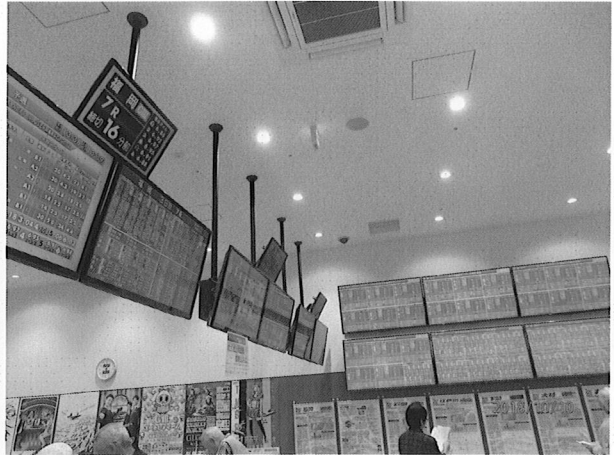
・施設内ファン用映像装置