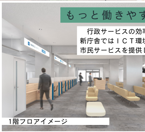
1階フロアイメージ