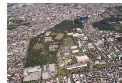
府中基地跡地留保地周辺地区