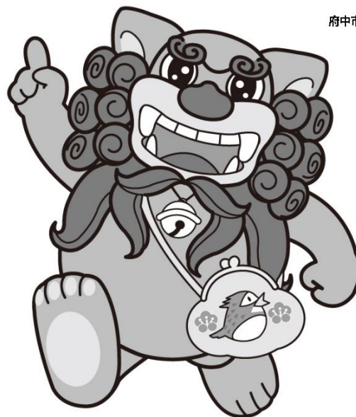
府中市マスコットキャラクター