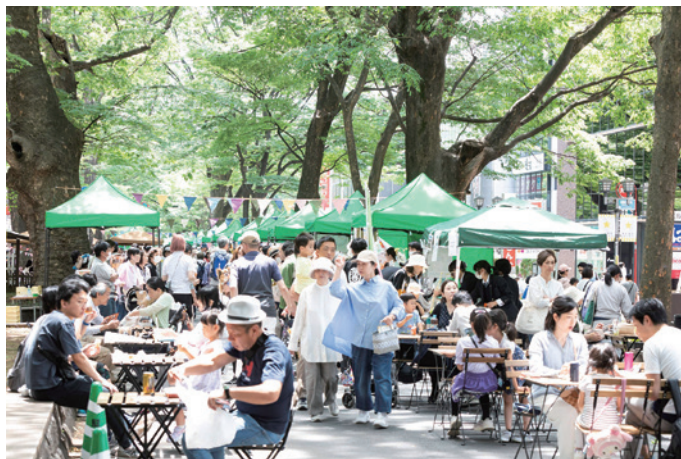
公共空間をいかしたにぎわいの創出