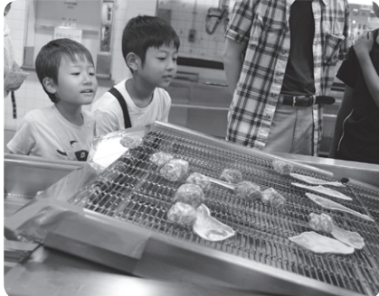
▲からあげはこうやってできるんだ

ボールを洗浄し、洗濯機のように回転する根菜皮むき機で一度にたくさんの野菜の皮をむくことができますと知りました。次は、冷凍庫の見学です。家の冷蔵庫が10台以上入りそうな大きな冷凍室の中はマイナス25度。「寒いー」と震えながらも、これまで体感したことのない温度に興奮するけやきっ子。続いて、さいの目切り機やりんご切り機の見学では、目の前で一瞬に