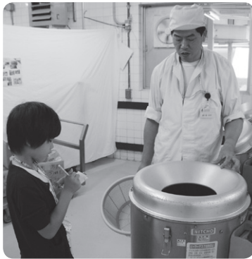
▲機械の説明を真剣に聞き取ります