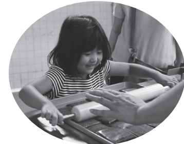
▲ハンバーグ作りを体験したよ

好きなからあげの作り方が見られたよ」「ハンバーグの作り方をみて、次に食べるのが楽しみです」と話してくれました。