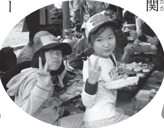
▲まずはバーベキューで腹ごしらえ

森林間伐とは、木を間引きする ことで一本一本の樹木に太陽の光 が十分に届くようにするもので、 豊かな森林を育てるために必要な ものです。けやきっ子 は、この間伐に関 わる体験をし ました。輪切り体 験では、森林組 合の方に補助を してもらいな がら、チェーンソー で木を切ります。太い木