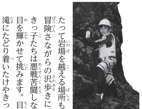
▲こんな岩場にも挑戦したよ

8月2日(火)・3日(水)に、 山梨県小菅村で多摩川源流体験教室 が行われました。