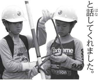
▲巻き結びに挑戦中!

という、結びやすくしてほどけに くい便利な結び方を教えてもらいま す。けやきっ子が挑戦してみると コツをつかむまでなかなか難しそ うでしたが、その分、結べた時の うれしさは倍増した様子でした。 「間伐することの重要さがわ かったよ」「毎年来てるけど、今 年はいろいろ体験できて楽しかつ た!」と話してくれました。