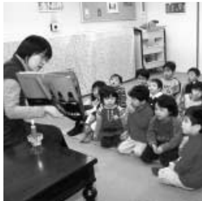
▲どんなお話が聞けるかな

■ 中央図書館「おはなしの森」 ▽日時 2月6日・13日・20日・27日(木)午後3時半(3歳以上)・4時(小学生) ■ 是政図書館 ▽日時 2月12日(水)午後3時半 ■ 新町図書館 ▽日時 2月19日(水)午後3時半 ■ 西府図書館 ▽日時 2月26日(水)午後3時半 ◇ ◇ ◇ ▽入場 自由(無料) ▽内容 絵本や昔話の読み聞かせ