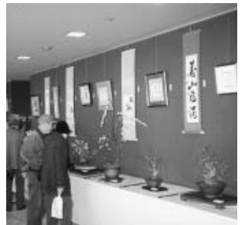
▲「うめ」にちなんだ作品が並びます

2月8日(土)から12日(水)午前9時～午後5時(12日は午後2時まで) 分館ギャラリー/無料/内容は市の花「うめ」にちなんだ盆栽や書の作品展/問合せは郷土の森博物館(368・7921)へ