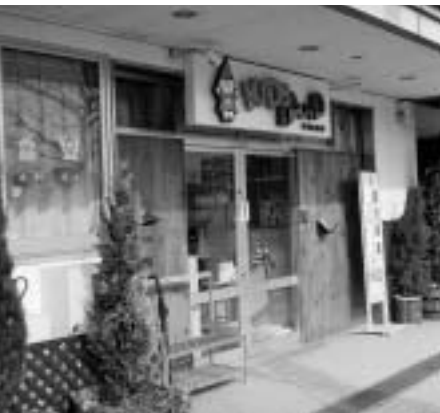
▲キッズランド府中

※市民税の額は、平成14年度の額です。 ※世帯構成員中、園児の扶養義務者の所得割課税額の合計を基準とします。