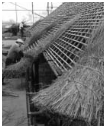
▲大変珍しいふき替え作業風景

2月15日(土)午後1時半～3時半 旧越智家住宅/対象は小学5年生以上の方/先着50人/内容は伝統職人による屋根のふき替え作業の見学会/申込みは電話で当館へ