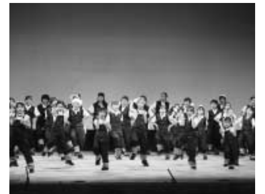
▲日ごろの練習成果を元気に発表