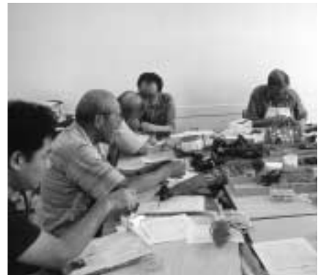
▲おもちゃを大切に

▽日時 2月8日(土)午前10時~午後3時/修理の受付は正午まで ▽会場 府中グリーンプラザ分館 ▽対象 市民 ▽費用 無料(部品代有料) ▽内容 壊れたおもちゃの修理/1世帯1点 ▽問合せ リサちゃんショップけやき(360・3751)