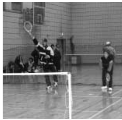
▲仲間と楽しくスポーツを

地域体育館(白糸台・押立・栄町・日吉・本宿・四谷体育館)の4~6月の団体・貸切利用の申込みを受け付けます。 ただし、四谷体育館は改修工事のため、利用受付は各地域体育館で受け付けます。 ▽日時 2月2日(日)から10日(月) ▽対象 次のすべてに該当する団体 ○10人以上の会員で組織した市内のスポーツクラブ、またはそれに準ずる団体であること ○営利を目的としていないこと ○ほかのクラブ・団体と協調して活動できること ▽申込み 決められた用紙(各地域体育館に用意)で、各地域体育館へ ▽問合せ ○白糸台体育館(363・1004) ○押立体育館(367・0750) ○栄町体育館(367・0611) ○日吉体育館(363・2501) ○本宿体育館(366・0831)