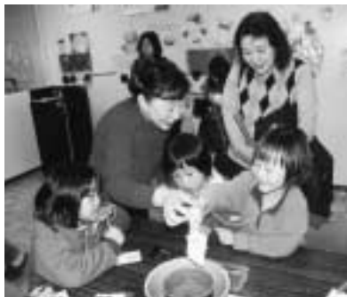
▲いろいろな体験ができます

▽問合せ 住吉文化センター(366・8611)、または新町文化センター(366・7611)