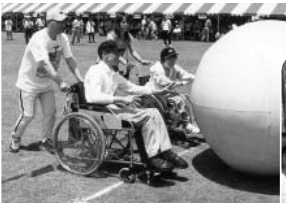
▲税は福祉や教育などのサービスに必要な財源です

昨年、市(都)民税の申告をされた方には、2月7日に市(都)民税の申告用紙を郵送しました。まだ届いていない方や申告が必要な方で用紙がない方は、市民税課へご連絡ください。