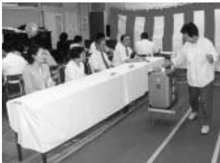
▲公益代表として立会います

▽日時 都知事選挙…4月13日(日)・市議会議員選挙…27日(日) / 時間はいずれも午前7時~午後8時(投票所への集合は午前6時半) ▽場所 市内50か所の投票所で、本人が選挙人名簿に登録されている投票所 ▽対象 平成14年12月26日以前から引き続き3か月以上市内に住所があり、選挙人名簿に登録されている、昭和52年4月14日から昭和58年4月14日生まれの20~25歳の方 ▽定員 各日50人(1投票所1人) ▽報酬 15000円 ▽内容 選挙の当日に公益代表として投票所での投票事務の立会い ▽申込み 2月25日(火)まで(必着)に、はがきに応募の動機、立会える選挙名、住所、氏名、年齢、性別、職業(学校名、学年)、電話番号を記入して、〒183-8703選挙管理委員会事務局へ / 1投票所に複数の申込みがあった場合は抽せん / 結果は後日通知 ▽問合せ 選挙管理委員会事務局選挙係(335・4486)