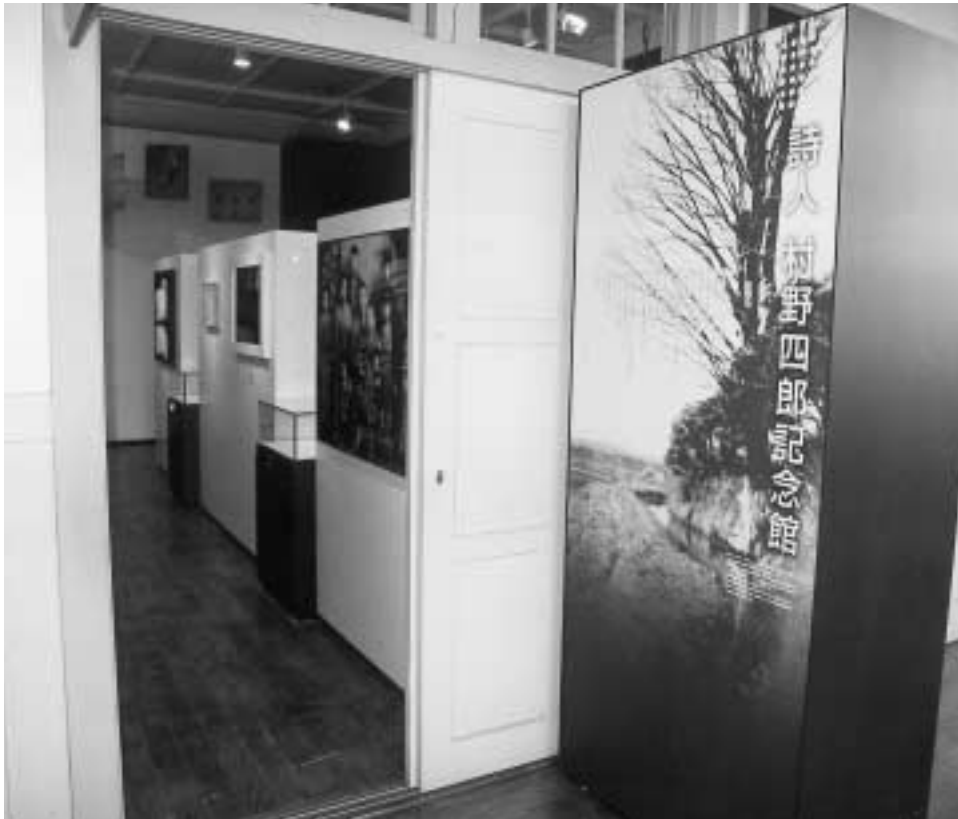
▲村野氏の様々な作品などを紹介しています

人口のうごき (平成15年1月1日現在) ○世帯数 104,158 (22減) ○人口 男118,537 (15減) 女112,292 (53増) 計230,829 (38増) うち外国人登録数3,734