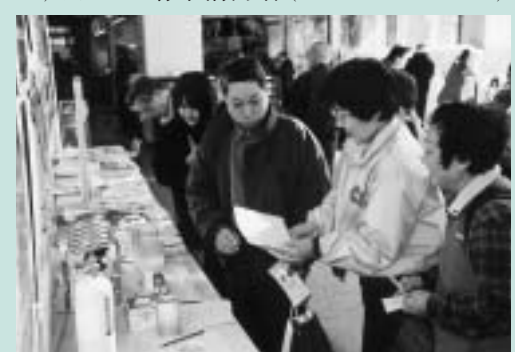
防災の意識を深めましょう

▽問合せ 防災課災害対策係(335・4098)、または府中消防署(366・0119)