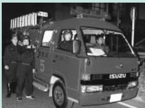
市民の安心のために