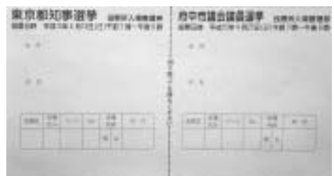
▲左側が都知事選挙、右側が市議会議員選挙の投票所入場整理券です

なお、今回郵送する投票所入場整理券で都知事選挙と市議会議員選挙の投票ができません。投票所入場整理券の中央にミシン目が入っていますので、投票の際は半分に切り離して、該当する選挙の投票所入場整理券をお持ちください。