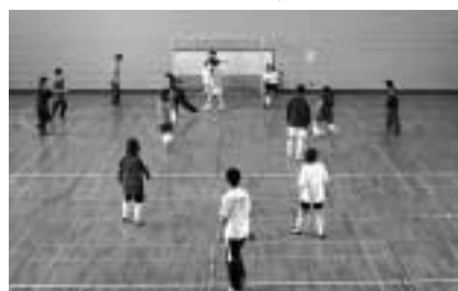
▲フットサルはだれもが気軽に楽しめるスポーツです

▽府中アスレティックフットボールクラブ(〒183-0011白糸台1の73/335・7559)