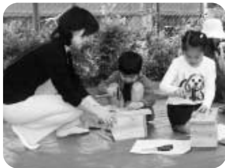
▲楽しく巣箱作りを