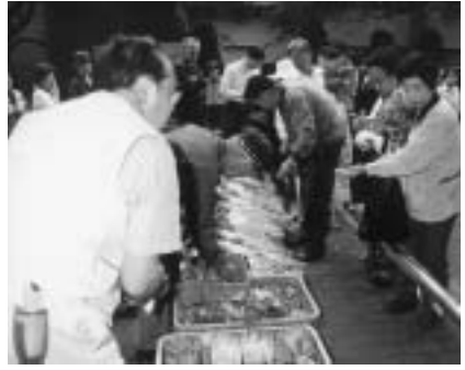
▲市民朝市に出店してみませんか