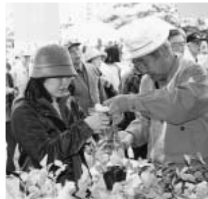
▲花や苗木を育ててみませんか