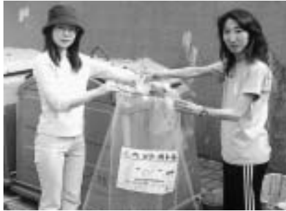
▲ペットボトルも大切な資源です