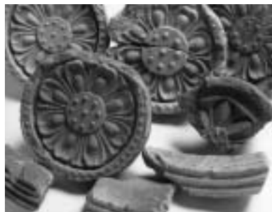
▲武蔵国府跡出土の軒がわら

▽集合場所 府中駅 ▽定員 40人 ▽費用 3000円(交通費・資料代・保険料)/昼食は各自用意 ▽内容 郷土の森博物館、川崎市市民ミュージアム「郡の役所と寺院」、横浜市歴史博物館「文字との出会い」の展覧会を巡る ▽申込み 5月2日(金)まで(当日消印有効)に、往復はがきに住所、氏名、年齢、電話番号、返信用あて名を記入して当館(南町6の32)へ/申込み多数の場合は抽せん