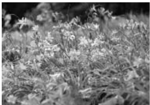
▲浅間山を彩るムサシノキスゲの群生

■キスゲフェスティバル ▽日程 5月3日(祝)・4日(日)・10日(土)・11日(日) 午前10時~午後4時/雨天中止 ▽会場 浅間山山頂あずま屋 ▽内容 浅間山に咲く花や自然などを写真パネルで展示、ムサシノキスゲ、キンラン、ギンランなどの紹介 ▽主催 武蔵野公園事務所、浅間山自然保護会、府中野鳥クラブ