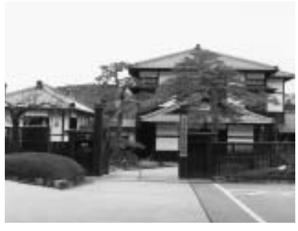
▲奥村土牛記念美術館