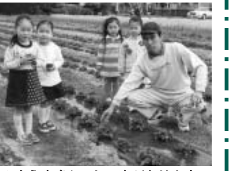
▲もうすぐおいしい実がなります