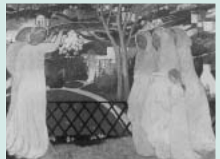
▲「キリストの墓を訪れる聖女たち」(1894年制作)/油彩・キャンバス/プリウレ美術館蔵