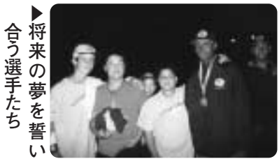
▶将来の夢を誓い合う選手たち

Wチャンピオンシップでは、1人ひとりが目標としている「世界一」に向かって全選手が出場し、それぞれが力を出し切って勝利し