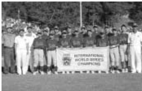
▲チャンピオンフラッグを手に優勝を喜ぶメンバー

武蔵府中リトルリーグが、8月15日から24日に米国ペンシルバニア州で行われたリトルリーグ世界選手権大会で、世界一を決めるワールド(W)チャンピオンシップへの予選となる国際グループで優勝を果たし、同じく米国グループで優勝したフロリダのチームとWチャンピオンシップへの進出を決め、10対1の圧勝で世界一に輝きました。