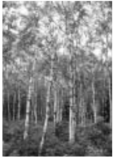
▲新緑のシラカバが楽しめます

▽宿泊 市民保養所「やちほ」 ▽主催 府中友好都市交流協会 ▽申込み 4月28日(水)まで(必着)に、往復はがき(1人1枚)に住所、氏名(府中友好都市交流協会会員はその旨も)、年齢、性別、電話番号、返信用あて名を記入して、府中友好都市交流協会事務局(〒183-8703生活文化部文化コミュニティ課内)へ/申込み多数の場合は抽せん ▽問合せ 府中友好都市交流協会事務局(335・4131=文化コミュニティ課内)