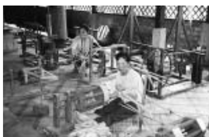
▲絹糸作業を行う女性たち