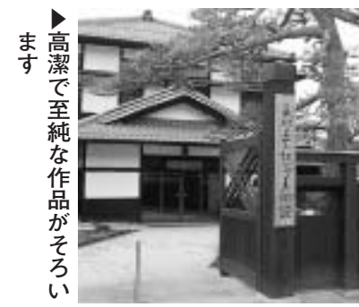
▶高潔で至純な作品がそろいます