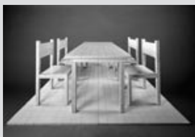
▲「遠近法の椅子とテーブル」(1966年/ラッカー・木) / 東京国立近代美術館蔵

日程・内容・講師は6月26日(土)「同時代者の証言」…中原佑介氏(美術評論家)、赤瀬川原平氏(画家)、7月17日(土)「実在と不在をめぐって」…高島直之氏(武蔵野美術大学教授)、松浦寿夫氏