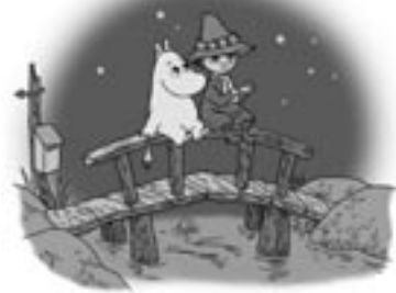
▲ムーミンとスナフキン

円(博物館観覧料が別に必要)/内容は「ムーミン谷の物語」…ムーミン谷の仲間たちが星空を案内する、親子星空散歩「星の動物園と七夕さま」(7月31日まで)