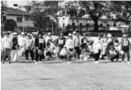
▲軽スポーツを楽しみましょう

▽日時 10月28日(木)午前9時~午後3時/雨天の場合は29日(金) ▽会場 市民陸上競技場 ▽対象 55歳以上の市民(免許証や保険証など年齢の確認できるものを持参) ▽種目 パン食い競走、風船割り、紅白玉入れなど12種目 ※競技への出場は、リレー以外の1種目に限ります。 ※車いすを利用している方が参加できる種目もありますので、参加を希望する方は前日までに、高齢者福祉課へ申込みください。 ▽申込み 当日午前8時40分までに、直接会場へ ※酒気帯びでの参加やアルコール類の会場への持ち込み、車での来場はできません。 ▽問合せ 高齢者福祉課在宅サービス係(335・4011)