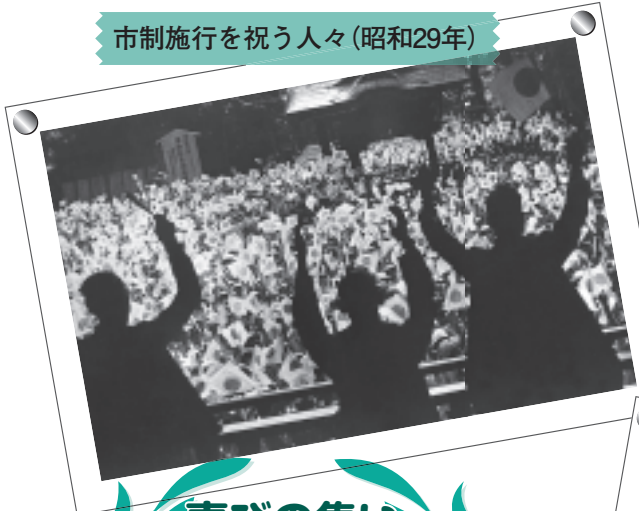
市制施行を祝う人々(昭和29年)