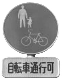
◀この標識のある歩道は自転車の通行ができます

に自転車などを放置すると、思わぬ事故につながります。放置は絶対にやめてください。 ■ルールを守って安全に 道路交通法では、自転車の走行が認められている歩道を走行する場合は車道側を徐行し、また歩行者の妨げになる場合は一時停止をすることが定められています。自転車と人の衝突による死亡事故も発生しています。歩道では自転車より歩行者が優先です。安全に走行するためルールを守りましょう。 ■自転車には防犯登録を 自転車の所有者には、防犯登録が義務付けられています。必ず防犯登録をし、自転車には住所、氏名を明記しましょう。