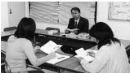
▲NPO法人設立の説明会