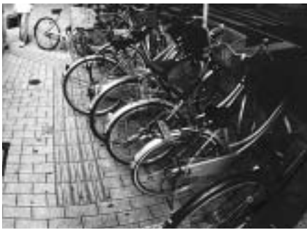
▶点字ブロック上への放置は危険です

■ちよこりんスポットについて 駅前再開発事業などによる駅周辺の店舗用自転車駐車場が整備されるまでの期間、臨時暫定的にけやき並木歩道部分に買物客など短時間利用者の自転車置き場「ちよこりんスポット」を設置しています。 「ちよこりんスポット」は、利用時間を制限してあります。利用時間は午前10時～午後8時の間で3時間以内です。時間外及び3時間以上駐車する方は駅周辺の自転車駐車場を利用してください。 ■点字ブロック 「点字ブロック(視覚障害者誘導用ブロック)」は、歩道上に連続して設置されている突起のあるブロックです。このブロックは、視覚障害のある方が安全に歩行できるように配置されていますので、周囲にご利用ください。