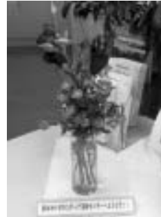
▲ボランティアの方たちが生けた花々が皆さんをお迎えします

や資料づくりなどに利用できる印刷機、紙折り機などの活動応援設備と会議や団体同士の情報交換などに利用できるスペースがあります。