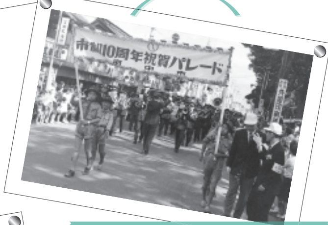
市制10周年を祝う祝賀パレード(昭和39年)

午前10時15分～11時50分 府中の森芸術劇場 どりーむホール 合唱劇シアターピース 「府中三景」の上演ほか ※入場の申込みはすでに終了しました。