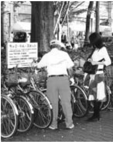
▶短時間利用者のための「ちよこりんスポット」

10月22日(金)から31日(日)に、駅前放置自転車クリーンキャンペーンを行います。期間中は、関係機関と協力して駅周辺の自転車放置防止を呼び掛けます。 現在、市内の各駅周辺には合わせて約1200台の放置自転車があります。「私の1台くらいなら」という気持ち様が様々な迷惑になります。 自転車を利用する一人ひとりがルールとマナーを守り、住みよいまちづくりにご協力ください。 問合せは、地域安全対策課施設管理係(335・4069)へ。