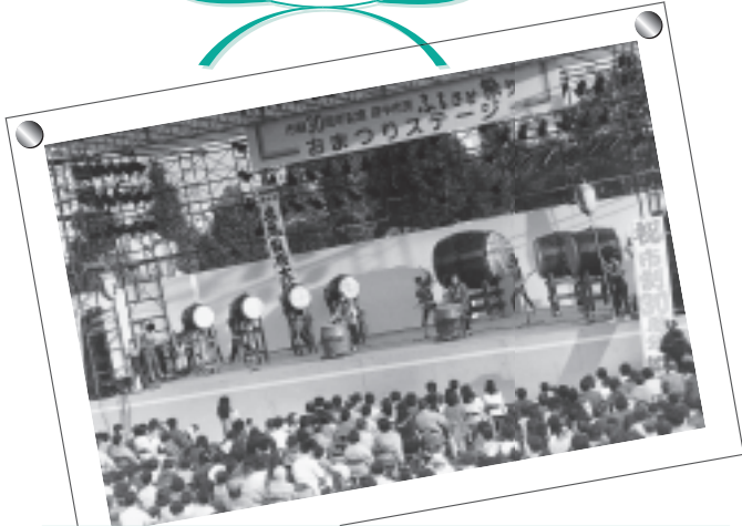
市制30周年記念「府中市民ふるさと祭り」(昭和59年)