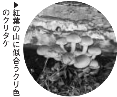
▲紅葉の山に似合うクリ色のクリタケ

などの広葉樹の紅葉が美しく、11月の初め頃には千曲川沿いの山々が、パレットにたくさんの絵の具を置いたような色とりどりの景観となります。