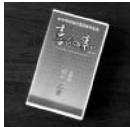
ぜひご覧ください

▽貸出開始日 1月20日(木) ▽貸出場所 中央図書館 ▽貸出ビデオ・規格 平成16年11月3日に、市制施行50周年記念催事として実施された「喜びの集い」「記念パレード」収録ビデオ/いずれもVHSテープ ▽問合せ 企画課市制50周年記念事業担当(335・4006)