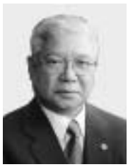
紅葉丘1の36 / 361・8177 / 74歳