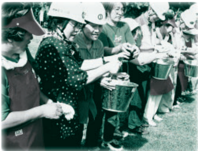
▲防災訓練に積極的に参加し、地域の防火安全対策と防災に対する備えを(総合防災訓練)