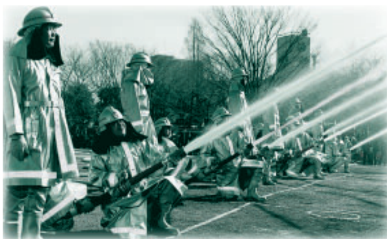
▲市民の安全を守るために活動する消防団

3月1日(火)から7日(月)に、春の火災予防運動を実施します。 この運動は、市民の皆さんに火災予防の意識を高めていただき、火災を予防し、火災による死傷者や財産の損失を防ぐことを目的としています。 地震による火災、放火など、予測できない原因で起こる火災もあります。日ごろから家庭での防火対策に心掛けましょう。 問合せは、防災課災害対策係(335・4098)、または府中消防署(366・0119)へ。