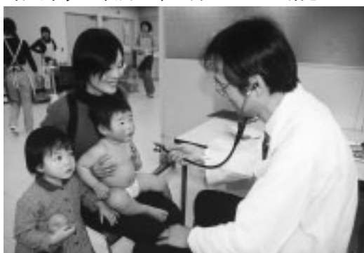
◀診察のほか、歯科・栄養相談などもあります

3月7日・14日・28日(月)／受付は午後1時～2時／対象は平成15年8月生まれの幼児