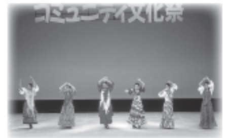
▲日ごろの練習の成果を発表します