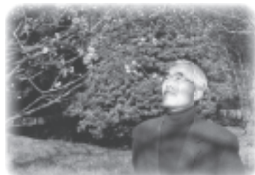
▲梅の香に春のそよ風を感じます

今年も、郷土の森博物館で梅まつりが始まりました。梅まつりは、これまで回を重ねること18回、年ごとに充実し発展している会場を歩いてみました。