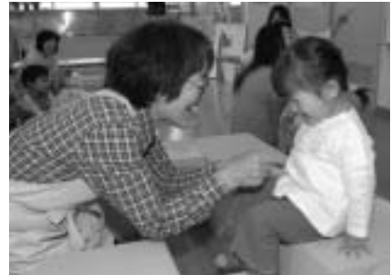
▲子育てを支援するボランティアです

子育てひろばポップコーンは、子育てに関心のあるボランティアの協力により運営しています。この事業にご協力いただけるボランティアを募集しています。 ▽活動日・会場 ○月曜日…新町文化 ○火曜日…総合体育館 ○木曜日…四谷文化 ○金曜日…第九・白糸台・住吉学童クラブ ▽時間 午前9時半~午後零時半 ▽内容 会場準備、受付、お誕生会などの進行ほか ▽申込み・問合せ 子育て支援課推進係(335・4192)へ