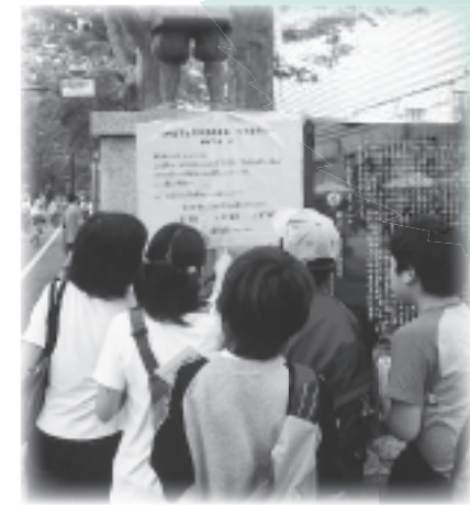
▲けやき並木とその周辺のことがわかるクイズラリー