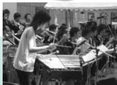
▲ジャズを聞きながらくつろぎの時を