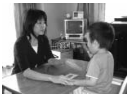
▲一人ひとりに合わせた支援づくり