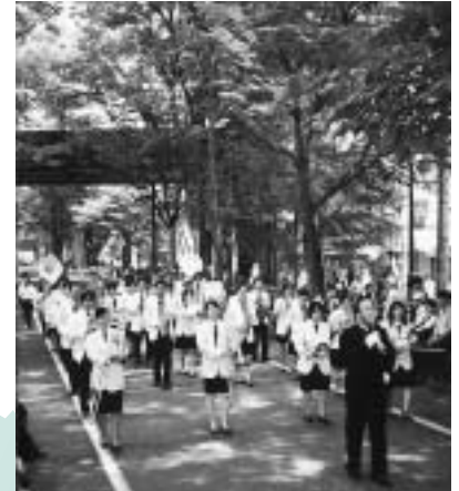
▲新緑の中に音楽が響き渡ります