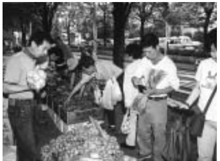
▲多くの人でにぎわいます

▽日時 5月29日(日)午前6時半~8時 ▽会場 府中公園 ▽出品 府中産農作物、魚、菓子、市民の手作り品ほか ※衛生上やむを得ない場合を除き、レジ袋は用意しませんので、マイバッグを持参してください。 ※JAマインズ多磨青壮年部による