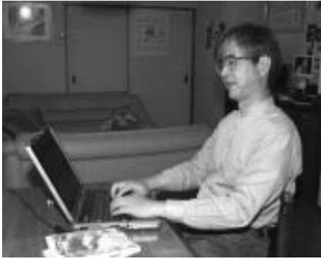
▲自宅から図書などの予約ができます

6月1日(水)から図書館のホームページ( http://lib.city.fuchu.tokyo.jp )を新しく、インターネットによる予約受付サービスを開始します。新しいホームページでは、従来の蔵書検索機能に加え、