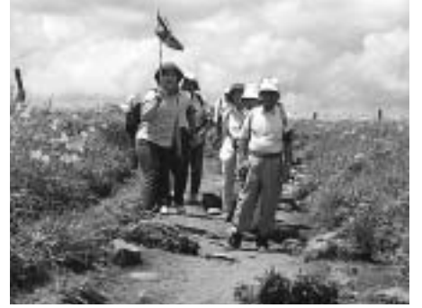
▲自然の中を楽しく歩きませんか