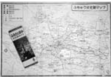
▲小さく折りたたみ携帯にも便利です

市内の文化財を7つのコースで紹介する地図を作成しました。住みなれたまち・歴史のある府中で、地図を片手に文化財めぐりをしてみませんか。 ▽販売場所 市役所1階市民相談室、府中駅北第2庁舎5階文化財担当、市政情報誌、観光情報誌、郷土の森博物館 ▽価格 100円(B2判二つ折り蛇腹折り) ▽問合せ 文化財担当(335-4473)