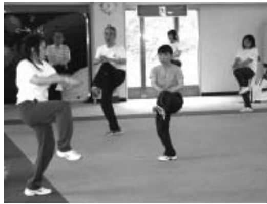
▲適度な運動で健康の維持を

健康増進事業は、30歳以上の方を対象に、高血圧、脳卒中、心臓病などの生活習慣病予防対策として実施しています。