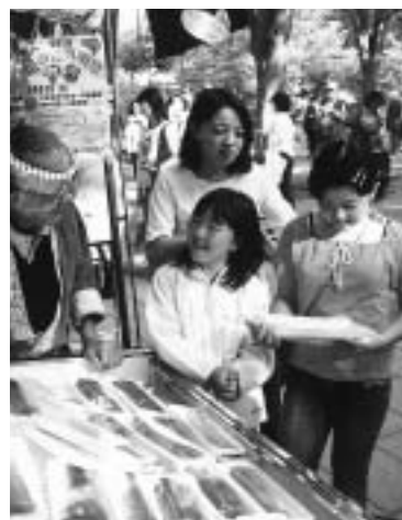
▲少し早起きして家族で出かけませんか

▽日程 7月11日(月)・12日(火) ▽場所 車山高原(長野県) ▽対象 70歳以上の健康な市民で、2時間程度のハイキングができる方/配偶者同伴での参加はどちらかが70歳以上であれば可 ▽定員 各日180人 ▽費用 1000円 ※昼食を持参してください。 ▽申込み 5月31日(火)まで(必着)に、はがき(1枚2人まで)に希望日、住所、氏名、年齢、電話番号を記入して、〒183-8703福祉保健部高齢者福祉課へ/申込み多数の場合は、6月6日(月)午前10時から市役所北庁舎3階会議室で公開抽せん/結果は6月中旬に通知 ▽問合せ 高齢者福祉課在宅サービ