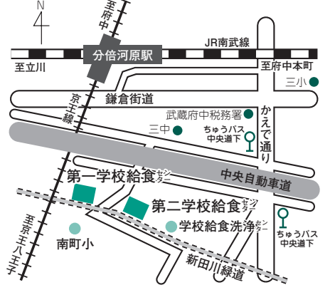
※車での来場はご遠慮ください。