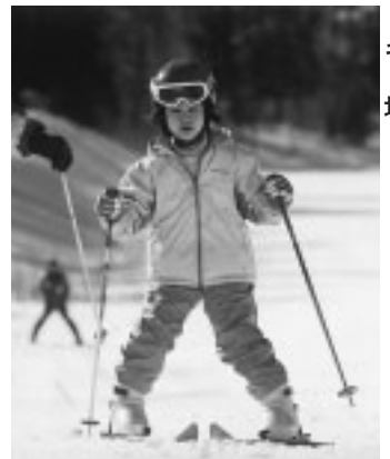
◀子供も楽しめる八千穂高原スキー場