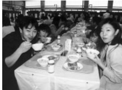
▲食育について考える機会に

■大試食会ゾーン…第一学校給食 △時間 午前11時・11時半、正午、午後零時半・1時・1時半 △定員 先着1000食(1人2食まで) △費用 1食100円 △献立内容 ○和食…吹き寄せごはん、かじきの三色あえ、けんちん汁ほか ○洋食…ほうれんそうパン、オムレツグラタン、ミネストローネほか ■展示ゾーン…第一学校給食 ○給食調理中の衛生コーナー ○食品衛生についてのパネル展示 ○給食の歴史や安全についての展示 ■体験ゾーン…第一学校給食 ○カードバイキングでの食事指導 ■紹介ゾーン…第一学校給食 ○学校給食の業務内容などを紹介したビデオ(約15分)の上映と調理場の見学 ■出展ゾーン…第二学校給食 ○地元産野菜や給食食材納品業者などによる食品の販売ほか