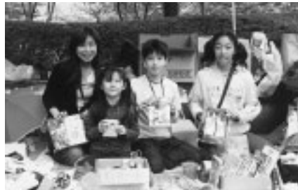
▲不要となったものをリサイクルしましょう

▽日時 11月5日(土)午前10時~午後3時/雨天の場合は6日(日) ▽会場 すずかけ公園 ▽対象 営利を目的としない市民/未成年者のみの出店不可 ▽出店数 100店(駐車場あり70店・なし30店/抽せん) ▽出店料 1000円 ▽主催 府中リサイクル推進協会 ▽申込み 10月10日(祝)まで(当日消印有効)に、往復はがき(1グループ・1世帯1枚)に代表者の住所、氏名、電話番号、駐車場利用の有無、返信用あて名を記入して、リサちゃんショップけやき(〒183-0056寿町1の1)へ ▽問合せ リサちゃんショップけや