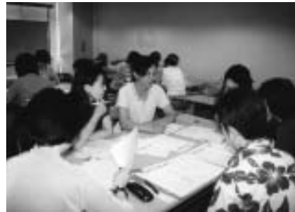
▲様々な情報を上手に收拾できるように