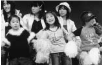
▲元気な姿をぜひご覧ください