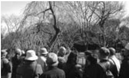
▲梅のことなら何でもお答えします