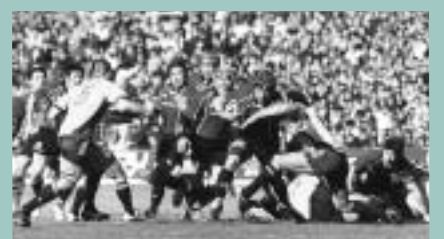
▲熱い戦いを繰り広げました

試合は、東芝府中がキックオフから立て続けに4トライを奪い、前半で22点をリード。サントリーも終盤2トライを決め追いつけたものの、前半の失点が響き、東芝府