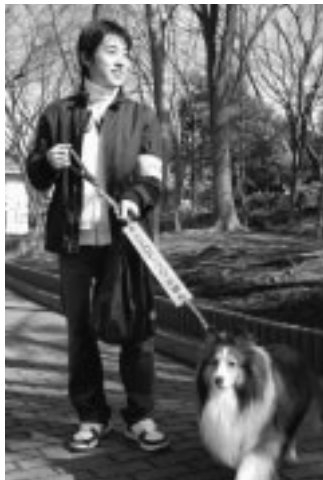
◀愛犬と一緒に地域の防犯パトロール

犬の散歩中にパトロール活動をしている方、これから活動をする方に登録していただき、パトロールグッズを配布します。 ▽対象 犬を飼っている市民 ▽申込み 市役所5階地域安全対策課へ ▽問合せ 地域安全対策課安全係(335・4147)