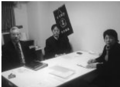
▲事業展開に向け準備を進めています