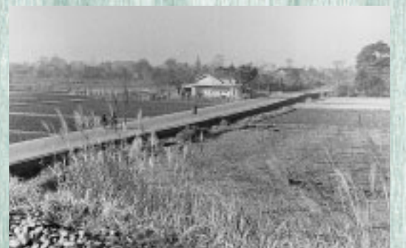
古くから人々の行き交う主要道路として親しまれてきた鎌倉街道

50年前には田畑が多くあった鎌倉街道周辺も、現在は、右の写真のとおり住宅が密集しています。また、4月には、街道の新しい顔として複合福祉施設「いきいきプラザ」が誕生します。