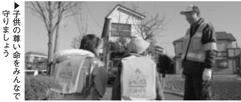
子供の尊い命をみんまで守りましょう

犯罪から子供たちを守るため、登下校時や地域生活の安全を確保する「子ども安全ボランティア」を募集します。 ▽内容 ○児童の登下校時の見守りと