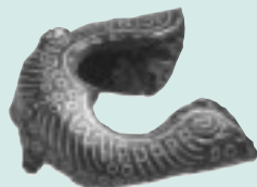
▲熊野神社古墳出土鞘尻金具

西府町にある武蔵府中熊野神社古墳は、最近の発掘調査で全国的に非常に珍しい飛鳥時代の上円下方墳であることが判明し、保存状態も良好なため、国の史跡に指定されました。 この武蔵府中熊野神社古墳と同時代に造られた全国各地の古墳からの出土品をもとに、飛鳥時代の古墳像や、葬られた人物像をテーマに展示会を開催します。 問合せは、郷土の森博物館(368・7921)へ。