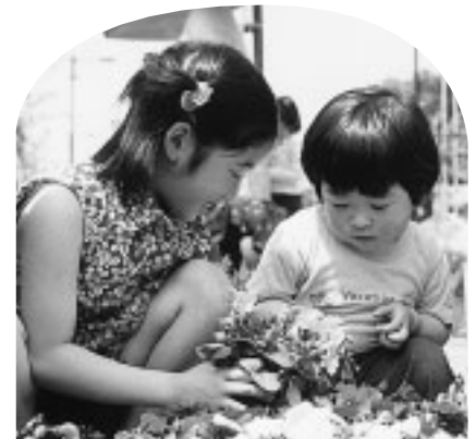
◀かわいい花がいっぱい

○府中囃子の演奏・演技(午前11時20分、午後1時50分)…出演は府中囃子保存会片町支部