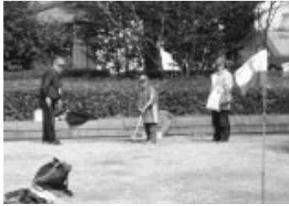
▲みんなが楽しめるグラウンドゴルフ