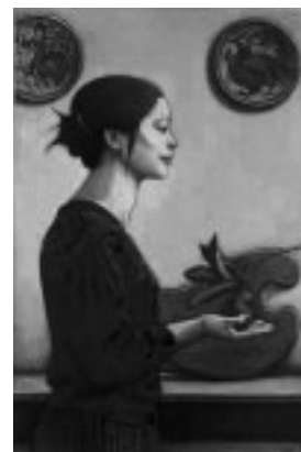
▲相笠昌義 「橘果を持つ女」1983年