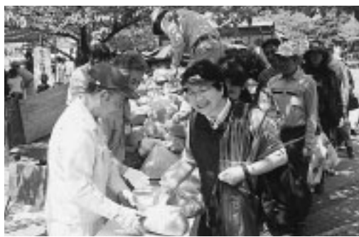
▲府中産の腐葉土の配布