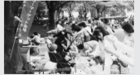
▲気軽に参加できるフリーマーケット

所、氏名、電話番号、返信用あて名を記入して、リサちゃんショップけやき(〒183-0056寿町1の1)へ ▽問合せ リサちゃんショップけやき(360・3751)