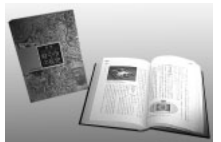
▲武蔵府中熊野神社古墳などの最新成果を盛り込んだ歴史書

▽販売場所 市役所1階市民相談室、府中駅北第2庁舎4階文化財担当、市政情報誌、観光情報誌、郷土の森博物館 ▽価格 3500円(A5判/504ページ)