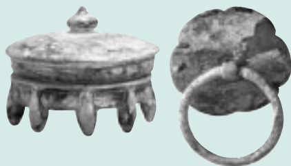
▲御坊山1号墳出土環座金具(右)、御坊山3号墳出土土三彩円面硯(左)

▽内容 熊野神社古墳、大塚遺跡(横浜市)、多摩川台古墳群(大田区)の見学 ②3館見学バスツアー ▽日時 6月18日(日)午前8時半~午後6時半 ▽内容 横浜市歴史博物館「弥生の人びとが眠る場所~方形周溝墓と環濠集落」、川崎市民ミュージアム「古墳の出現とその展開」、郷土の森博物館の展示会を巡る ◇ ◇ ◇ ▽集合場所 府中駅改札口 ▽定員 各40人(抽せん) ▽費用 3500円(交通費・資料代・保険料ほか)/昼食は各自用意 ▽申込み ①は5月6日(土)、②は6月1日(木)まで(当日消印有効)に、往復はがきに住所、氏名、電話番号、返信用あて名を記入して、郷土の森博物館(〒183-0026南町6の32)へ