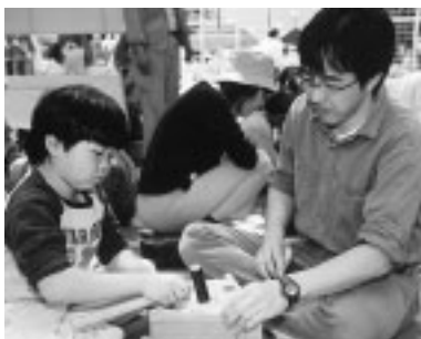
▲親子でできる巣箱作り

○草笛の演奏・指導(午前11時40分～午後零時10分)…草笛の演奏と作り方指導ほか