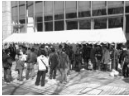
▲多くのファンが集まった販売会