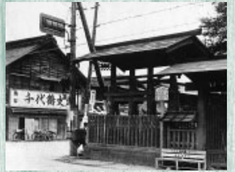
上の写真は昭和30年ごろの高札場です。当時の高札は北を向いていました。

高札場の後ろには、大國魂神社の御旅所があり、5月5日のくしらやみ祭に繰り出す神輿はここで一夜を明かします。