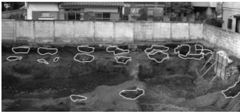
武蔵国衙跡の大型建物の柱穴

3月28日に、武蔵国衙跡がある宮町2丁目の遺跡保存地区を、市の史跡に指定しました。国衙は、奈良・平安時代の国府の中心であった役所で、現在の都庁などにあたります。 問合せは、文化財担当(335・4473)へ。