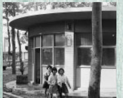
(写真上)昭和35年当時のレストハウス、(写真下)現在の観光情報センター

その後、観光事業の推進とトイレの老朽化に伴い、平成17年5月に、だれもが安心して利用できるトイレを備えた観光情報センターとして生まれ変わり、現在では、様々な観光情報の収集・発信の場として、多くの人に利用されています。