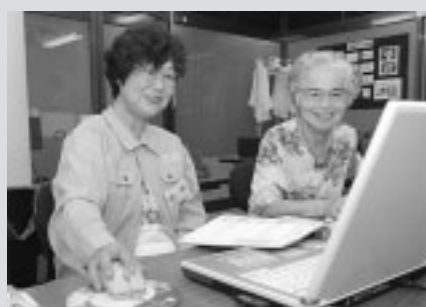
▲技術を生かしたパソコン教室