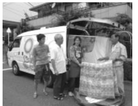
▲「ふとん乾燥車」が伺います