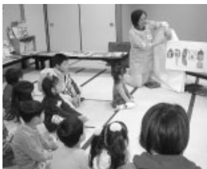
▲読み聞かせや児童文学の講座も実施します