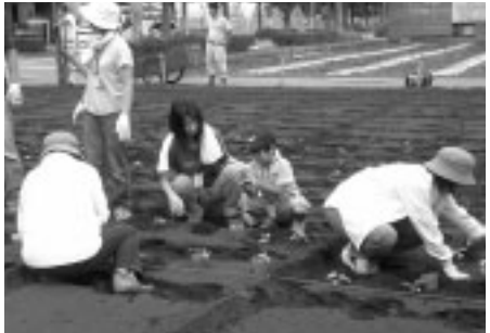
▲収穫が楽しみです

農家の方の指導のもと、野菜の植付けや収穫などの畑作業を行います。野菜の成長や身近な農業を学びながら新鮮な野菜を味わってみませんか。 ▽日程 8月20日から12月の日曜日午前中(全8回程度) ▽場所 紅葉丘3の2の農地 ▽対象 市民 ▽定員 40人(抽せん) ▽費用 無料 ▽内容 キャベツ、白菜、ブロッコリー、大根などの植付け・収穫ほか ▽講師 府中市農業後継者連絡協議会役員 ▽申込み 8月4日(金)まで(必着)に、往復はがきに希望者全員の住所、氏名、年齢、電話番号、学生の場合は学校名・学年、返信用あて名を記入して、〒183-8703生活文化部経済観光課へ ▽問合せ 経済観光課農政係(335・4143)