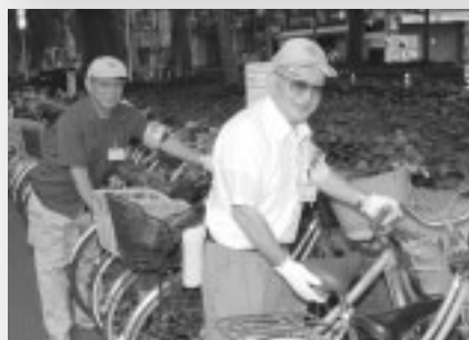
▲歩行者の安全を守る自転車整理