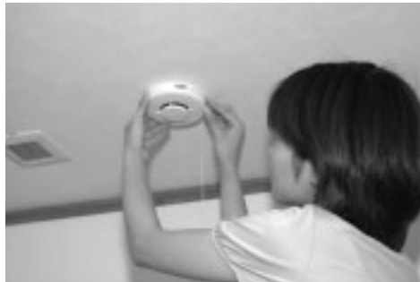
▲早目に設置しましょう