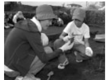
親子で文化財に触れる機会に

■古民家めぐりレトロツアー 11月11日(土)午後1時~2時 郷土の森博物館/小雨実施/費用大人200円、中学生以下100円(博物館観覧料)/内容は復元建築物を大道芸人と学芸員の案内で巡る/申込みは当日直接郷土の森博物館本館前へ