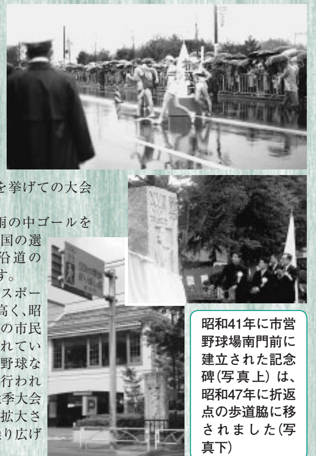
昭和41年に市営野球場南門前に建立された記念碑(写真上)は、昭和47年に折返点の歩道脇に移されました(写真下)

以前から市民のスポーツに寄せる関心は高く、昭和33年に第1回目の市民体育大会が開催されています。当時は陸上・野球など7種目の競技で行われましたが、現在の秋季大会では29種目にまで拡大され、今年も熱戦が繰り広げられます。