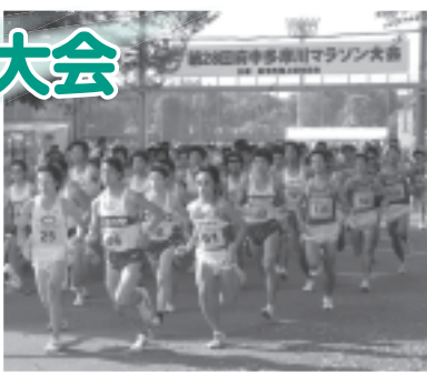
自分の力を信じて

▽日時 11月23日(祝)午前9時~午後3時 ▽会場 府中多摩川かぜのみち ▽種別 1・2部...ハーフマラソン、3部...10キロ、4部...5キロ ▽対象 中学生以上で、1部は1時間45分以内、2部は2時間45分以内、3部は1時間10分以内、4部は35分以内で走れる方(部内での区分あり) / 中学生の参加は4部で、保護者の承諾が必要 ▽費用 3000円 / 納入後の返却不可 ※完走者全員に記録証と参加記念品を贈呈します。 ※記録集(1部300円 / 郵送料を含む)