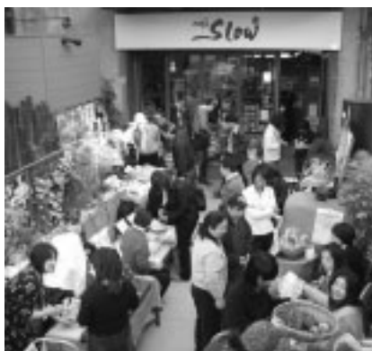
▲地域通貨「ナマケ」を使用した地域通貨市