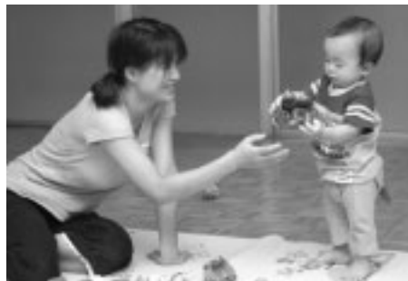
▲地域の子育て活動を応援します

地域での子育て機能の強化や子育て家庭の孤立化の防止などを目的として、子育て家庭の方を対象に親子の交流や子育ての仲間づくりなどに取り組む団体に活動経費の一部を補助します。 ▽対象 次のすべてに該当する団体 ○活動場所が市内の公会堂や集会所であること ○対象が主に0~3歳児のいる親子で無料で参加できること ○6人以上の会員で構成されている団体であること ○団体構成員の子供が活動目的の対象でないこと ○月2回以上、事業を開催すること ○事業の開催日に、3人以上の会員が出席すること ○営利・宗教・政治活動などを目的とした活動でないこと ▽定員 7団体(抽せん) ▽補助額 10月1日(日)以降の活動費(飲食代を除く)の2分の1以内で24000円を限度 ▽申込み 9月28日(木)までに、子育て支援課へ ▽問合せ 子育て支援課推進係(335・4192)