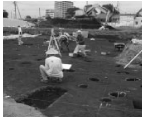
▲調査が進む西府土地区画整理地区