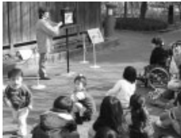
いろいろなお話が楽しめます

11月25日(土)午後2時45分 旧郵便取扱所脇/対象は5歳以上の方/内容は「おひゃくしょうとえんさま」「おひさまときたかぜ」ほか/語りは十べえお話の会