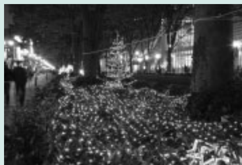
▲やさしい光に包まれたけやき並木