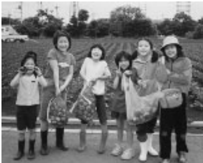
▲農業体験を通して助け合いと収穫の喜びを学びます