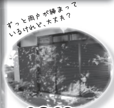
ずっと両戸が締まって いるけれど、大丈夫?