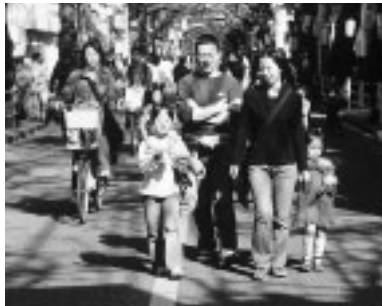
◀家族のきずなを大切に