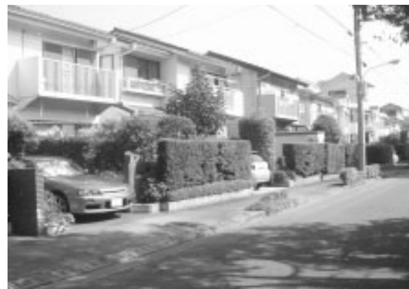
▲市民提案を基に町並みが形成された住宅地区