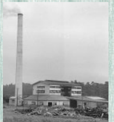
(写真上)昭和33年当時の二枚橋衛生組合、(写真下)現在の二枚橋衛生組合

生活の向上とともにごみ量が増加する中、増設工事や改築工事を経て、稼動から50年余りにわたり市の衛生事業の一翼を担ってきた二枚橋衛生組合ですが、老朽化により平成19年3月で焼却場を閉鎖するため、ごみ減量は重要かつ緊急の課題となっています。