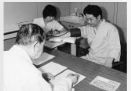
▲定期的な健診で健康な毎日を

※Bコースは上部消化管X線を除きます。 ※国民健康保険加入者負担額は、年度1回の適用です。