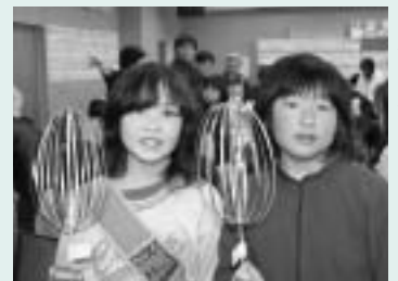
▲科学に触れながら作品作りを