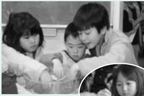
▲楽しい体験コーナーが目白押し