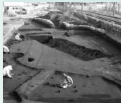
▲中世屋敷跡(西府町)の発掘風景

市内には、原始・古代の遺跡が数多くあります。今回の特別展では、武蔵国府の国衙跡近くで出土した、中国・越州窯製の青磁の碗を展示するほか、西府町で発掘された中世の屋敷跡など平成17年度の発掘調査を中心に、最近の成果を