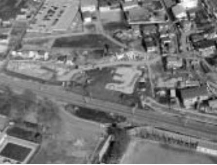
▲西府駅とその周辺整備が進む西府土地区画整理地区