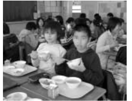
▲健康な毎日は正しい食事から