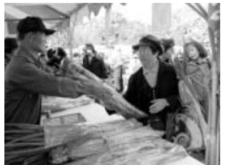
▲農業を身近なものに

農業振興計画に基づき、認定農業者制度を推進するとともに、地産地消の拡大を図るなど、豊かな市民生活を支える府中農業の実現を図ります。