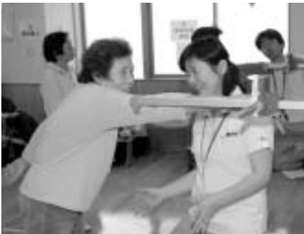
▲定期的な健診は元気な体づくりの第一歩

○保育所整備事業(耐震診断調査委託、三本木保育所増築ほか) .....2億4695万5千円