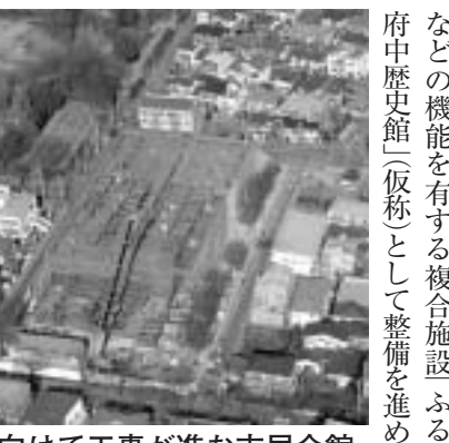
▲開館に向けて工事が進む市民会館・中央図書館複合施設

●図書館…12月に開館予定の新中央図書館でのよりきめ細やかなレファレンスサービスや情報化社会に適応した図書館機能の充実を図るとともに、開館を記念した講演会や絵本の原画展、大賀博士から寄贈された蔵書の整理・活用を行います。また、現在の中央図書館は、武蔵国府に特化した「記念ホール」資料の収集や保存などを行う「文書館」や「地区図書館」などの機能を有する複合施設「ふるさと府中歴史館(仮称)」として整備を進めます