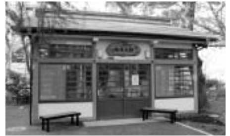
▲障害のある方の就労を支援します

障害のある方の生活や自立を支援するため、障害の内容や程度に応じた、きめ細かいサービスを行います。また、大國魂神社境内に設置する茶屋と小柳町に整備する農園を利用し、就労支援を行います。