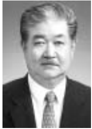
副市長 中島信一氏 宮西町5の4 / 68歳 / 前助役