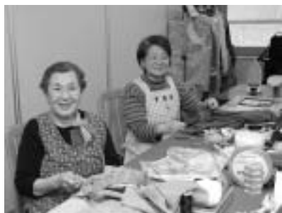
▲心を込めて丁寧に仕事をします