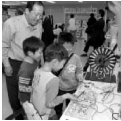
▲市内工業と触れ合うテクノフェア

●第5次府中市総合計画後期基本計画…市民参加の課題別検討協議会の意見などを踏まえ、総合計画審議会で審議いただき、将来を見据えた、分かりやすく、実効性のある計画を策定します