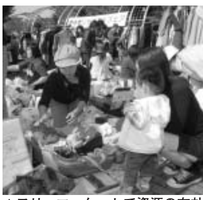
▲フリーマーケットで資源の有効活用を

●市民聖苑…式場の増設や運営方法の見直しにより、待ち日数の短縮に努めます ●ごみの減量とリサイクルの推進…二枚橋衛生組合の焼却炉の停止に伴い、多摩川衛生組合へ全域加入し、ごみの安定的処理に努めます。また、推進審議会からの答申に基づき、本市にふさわしい循環型社会の構築に向けて、市・市民・事業者が一体となって取り組むことのできる施策を検討します