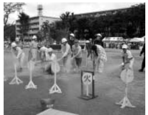
▲日ごろから非常時に備えた訓練を

都の地域防災計画の修正を踏まえて、府中市地域防災計画の見直しを行います。また、中央防災センター(仮称)建設を推進するとともに、災害時の拠点施設の設計、多目的防火貯水槽を新設するなど、災害に強いまちづくりを推進します。