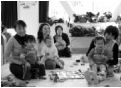
▲子育てを支援します

次世代育成支援行動計画を推進し、安心して子供を生み、育てられる環境づくりを目指すため、子育て支援策や保育サービスを充実します。また、待機児童の解消のため保育定員を増やします。