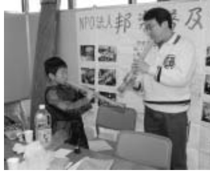
▲様々な団体の活動を紹介するNPO・ボランティアまつり