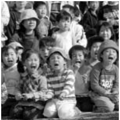
▲子供たちの健やかな成長を願って

●第5次府中市総合計画後期基本計画…市民参加の課題別検討協議会の意見などを踏まえ、総合計画審議会で審議いただき、将来を見据えた、分かりやすく、実効性のある計画を策定します