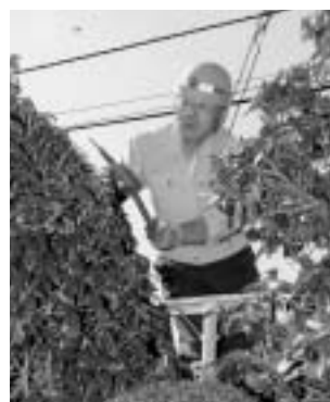
◀あなたの技術や経験を地域社会に生かしませんか

布団乾燥サービスでは、「ふとん乾燥車」が伺い、60度の温度で約50分間乾燥します。ダニなどはすべて死滅し、ヒノキから作られた安全で無害なヒノキチオールによる消臭も行ないます。布団を干すことが困難な方や花