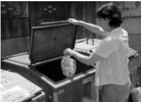
▲皆様のご意見をお寄せください