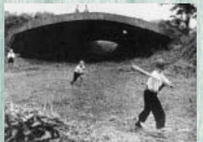
(写真上)役目を終えた昭和29年ごろの掩体壕、(写真下)ここだけ時間が止まっているような現在の掩体壕