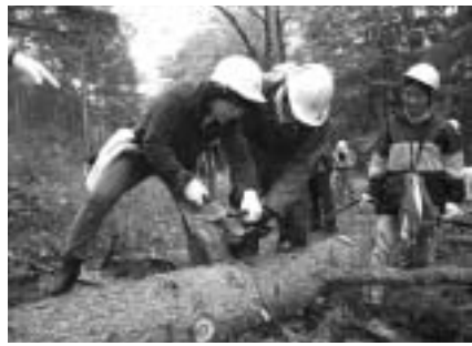
▲森林の役割りや大切さが学べます

姉妹都市の長野県佐久穂町で、カラマツの間伐や製材作業、巣箱作りなどの林業体験を通し、森林・水源保護の体験学習をしてみませんか。 ▽日程 9月29日(土) ▽集合時間・場所 午前7時15分に観光情報センター ▽対象 小・中学生の市民(小学生は保護者同伴可) ▽定員 60人(抽せん) ▽費用 小・中学生1000円、保護者3000円(昼食代、保険料ほか) ▽申込み 8月31日(金)まで(必着)に、往復はがきに参加希望者全員の住所、氏名(ふりがな)、年齢、電話番号、返信用あて名を記入して、東京武蔵府中ロータリークラブ事務局「森林間伐体験」係(〒183-0056寿町1の1の11)へ ※9月8日(土)午前10時半から大國魂神社で説明会を開催します。 ▽問合せ 市民活動支援課都市交流担当(335・4131)、または東京武蔵府中ロータリークラブ事務局・小川あて(360・6655)