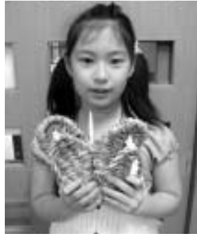
◀りっぱなわらぞうりが完成

9月2日(日)午後1時～3時 ふるさと体験館 ／対象は小学5年生以上の方 ／先着10人／費用1000円 ／申込みは電話で当館へ