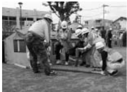
▲いざという時に備えて