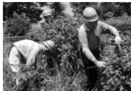
▲生きがいのある充実した生活を

10月9日(火)から11月5日(月)(全14回) 東京しごとセンター(千代田区飯田橋)ほか/対象は60歳以上の市民でシルバー人材センターへ入会し、就業を希望する方/申込みは8月28日(火)までに、電話でシルバー人材センターへ/問合せも同センターへ