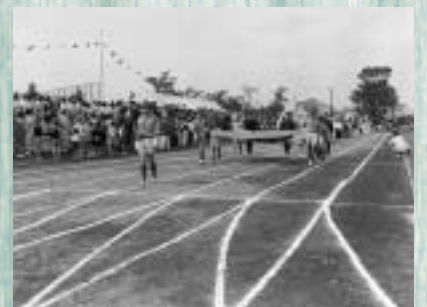
(写真上)昭和33年の市民大会開会式、(写真下)現在の市民陸上競技場

今年も、9月23日(祝)に市民体育大会秋季大会開会式が行われ、約2か月にわたり29競技の熱戦が繰り広げられます。