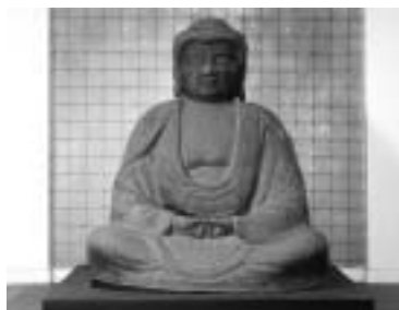
▲鉄造阿弥陀如来坐像(国指定重要文化財)