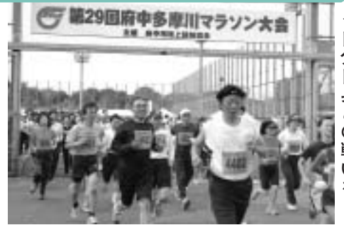
◀自分自身の戦いを

▽日時 11月23日(祝)午前9時~午後3時 ▽会場 府中多摩川かぜのみち ▽種別 1・2部...ハーフマラソン、3部...10キロ、4部...5キロ ▽対象 中学生以上で、1部は1時間45分以内、2部は2時間45分以内、3部は70分以内、4部は35分以内で走れる方(部内での区分あり)/中学生の参加は4部で、保護者の承諾が必要 ▽費用 3000円/納入後の返却不可