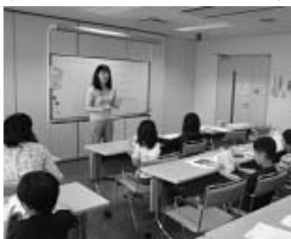
▲ゲームなどを取り入れながら楽しく学べる「ちびっ子マネー教室」