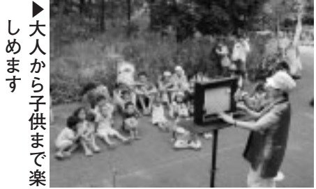
大人から子供まで楽しめます

11月10日(土)午後2時45分 旧越智家住宅/対象は5歳以上の方/内容は「つる女房」「モチモチの木」ほか/語りは十べえお話の会