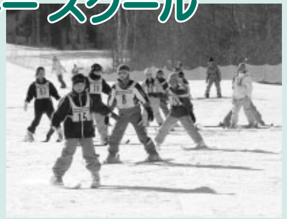
白銀の世界でスキーを学ぼう

な)、年齢、学校名・学年、電話番号、スキー経験の有無、返信用あて名を記入して、〒183-8703生涯学習部体育課へ ▽問合せ 体育課振興係(335・4499)