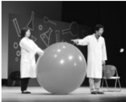
▲楽しい実験がいっぱいです

▽定員 各回520人(抽せん) ▽費用 無料 ▽内容 科学の実験を体験して、その謎に迫る ▽申込み 11月21日(水)まで(必着)に、往復はがきに観覧希望時間、代表者の住所・電話番号、参加希望者全員の氏名・学年(年齢)、返信用あて名を記入して、多摩・島しょ子ども体験塾事務局(〒156-0043世田谷区松原3の40の7ヴォートル内)へ ▽問合せ 企画課(335・4010)、または多摩・島しょ子ども体験塾事務局(03・5301・0946) / 多摩・島しょ子ども体験塾事務局への連絡は平日午前10時~午後6時に