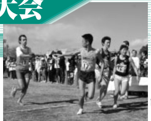
▲チームの思いをたすきに託して

参加費分の定額小為替を、府中駅伝競走大会事務局(〒183-8703生涯学習部体育課内)へ/持参可/決められた用紙の郵送を希望する方は、返信用封筒に80円切手をはって大会事務局へ ▽問合せ 体育課振興係(335・4499)