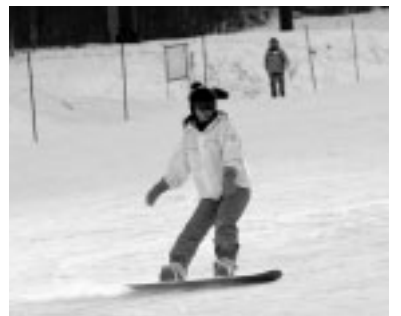
▲ぜひ、ご利用ください

▽申込み 顔写真(縦3センチ×横2.5センチ)、身分証明書(運転免許証、学生証など)を持って、直接八千穂高原スキー場管理棟へ