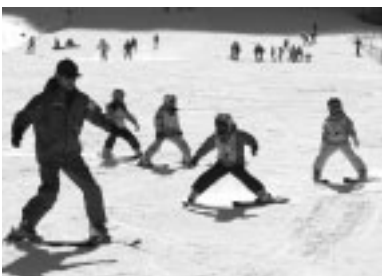
▲スキーの基礎を学びましょう

▽申込み 八千穂高原スキー場ジュニアランドクラブハウス(0267・88・3955)へ