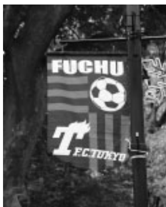
皆さんの思いを作品に

についてのコメントを添えて、FC東京事務所「街路灯バナーフラッグ」係(〒182-0032調布市西町376の3味の素スタジアム内)へ