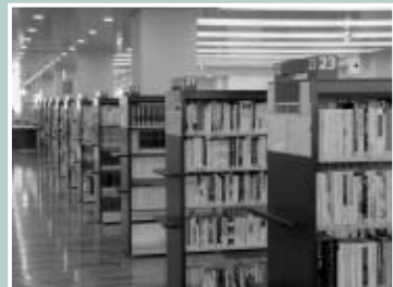
▲多摩地域随一の広さを誇る中央図書館