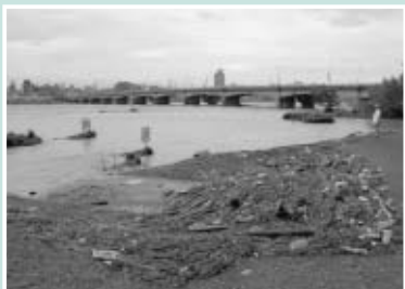
▲台風直後の多摩川緑地(住吉地区)

▽23日…「市民体育大会秋季大会」の開会式を市民陸上競技場で開催 ▽28日…三中の新校舎が完成 ※台風9号によって多摩川が増水。