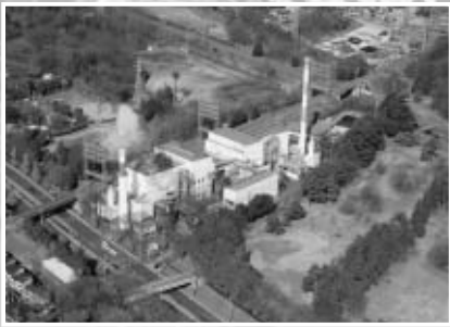
▲約50年間稼働してきた二枚橋衛生組合焼却場

▽10日…「心の健康フェスティバル」を府中グリーンプラザで開催 ▽26日～4月8日…「市民桜まつり」を桜通りと府中公園を中心に開催 ▽31日…老朽化に伴い、昭和33年から調布・小金井市とともにごみを焼却してきた二枚橋衛生組合の焼却炉が停止