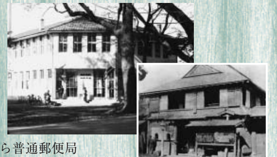
(写真左上)昭和33年ごろの武蔵府中郵便局、(写真右上)明治12年ごろの矢島家、(写真下)現在の武蔵府中郵便局

今年の10月に郵政民営化のため郵便局株式会社として新たにスタートした郵便局は、年明けに皆さんへ年賀状を届けるために現在も尽力してくれています。