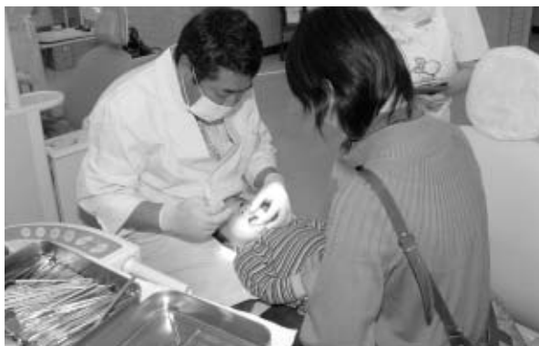
▲虫歯にならないために

①2月7日(木)午前9時半～11時15分、午後1時15分～3時・②14日(木)午前9時半～11時15分、午