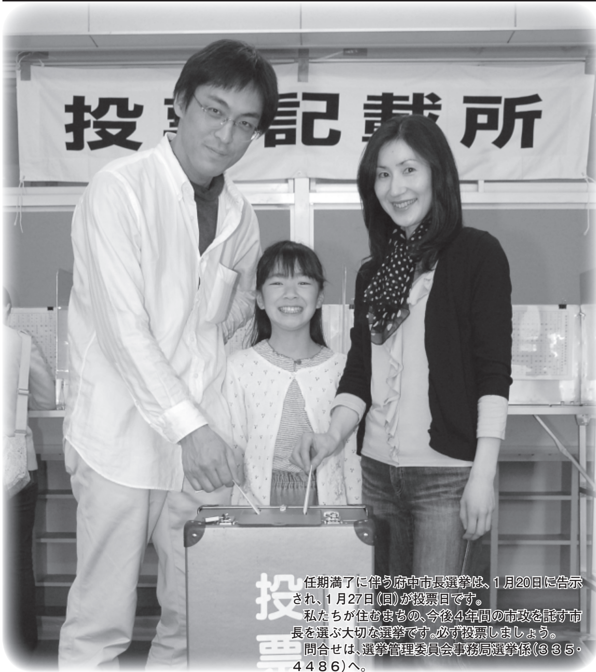
任期満了に伴う府中市長選挙は、1月20日に告示され、1月27日(日)が投票日です。私たちが住むまちの、今後4年間の市政を託す市長を選ぶ大切な選挙です。必ず投票しましょう。問合せは、選挙管理委員会事務局選挙係(335-4486)へ。