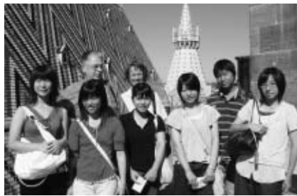
▲ウィーン市内を見学する派遣生

心のある方 ○市、または府中国際友好交流会が実施した海外派遣事業に参加したことがない方 ○ホームステイ後に学校や地域で成果を生かす活動ができる方 ○ホームステイ事前研修に全回参加できる方 ▽定員 6人 ▽費用 20万円 ▽申込み 3月7日(金)までに、決められた用紙(市役所4階市民活動支援課、府中国際友好交流会に用意)で、市民活動支援課へ ※用紙は市のホームページ( http://www.city.fuchu.tokyo.jp/ )からもダウンロードできます。 ※3月16日(日)に面接・選考を行います。 ▽問合せ 市民活動支援課都市交流担当(335・4131)、または府中国際友好交流会(336・9027)