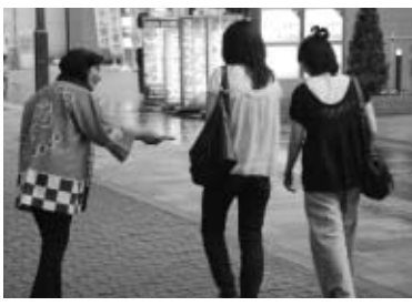
▲大切な一票への参加を呼びかけます

日ごろから、明るくきれいな選挙が行われることを目指して活動している、府中市明るい選挙推進協議会・推進委員の方と東京競馬場のポニーが、1月24日(木)午後3時から府中駅周辺で、投票への参加を呼びかけます。