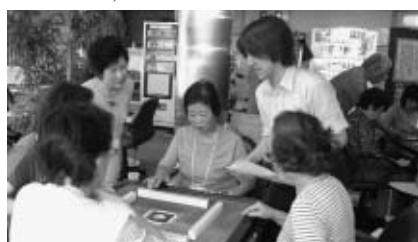
▲丁寧な指導でマージャンを楽しみます