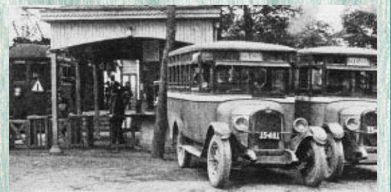
(写真上) 昭和4年ごろの多磨霊園駅と甲州街道乗合自動車

また、府中～新宿間全線開通に先立ち、大正2年に多磨村・府中町・西府村(後に合併して府中市になる)に電気供給が開始されました。調布町を含め612戸、1戸当たり2灯の電灯が設置され、人々の生活に新たな光をともしました。