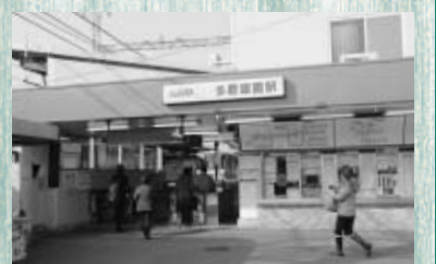
(写真下) 現在の多磨霊園駅